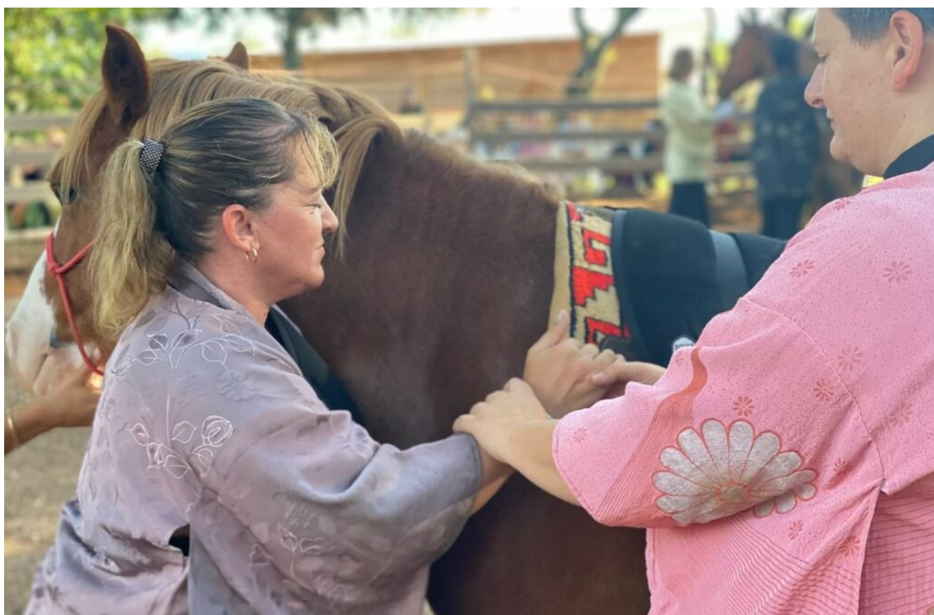
Accompagnement de femmes lors d'un atelier d'équihomologie.