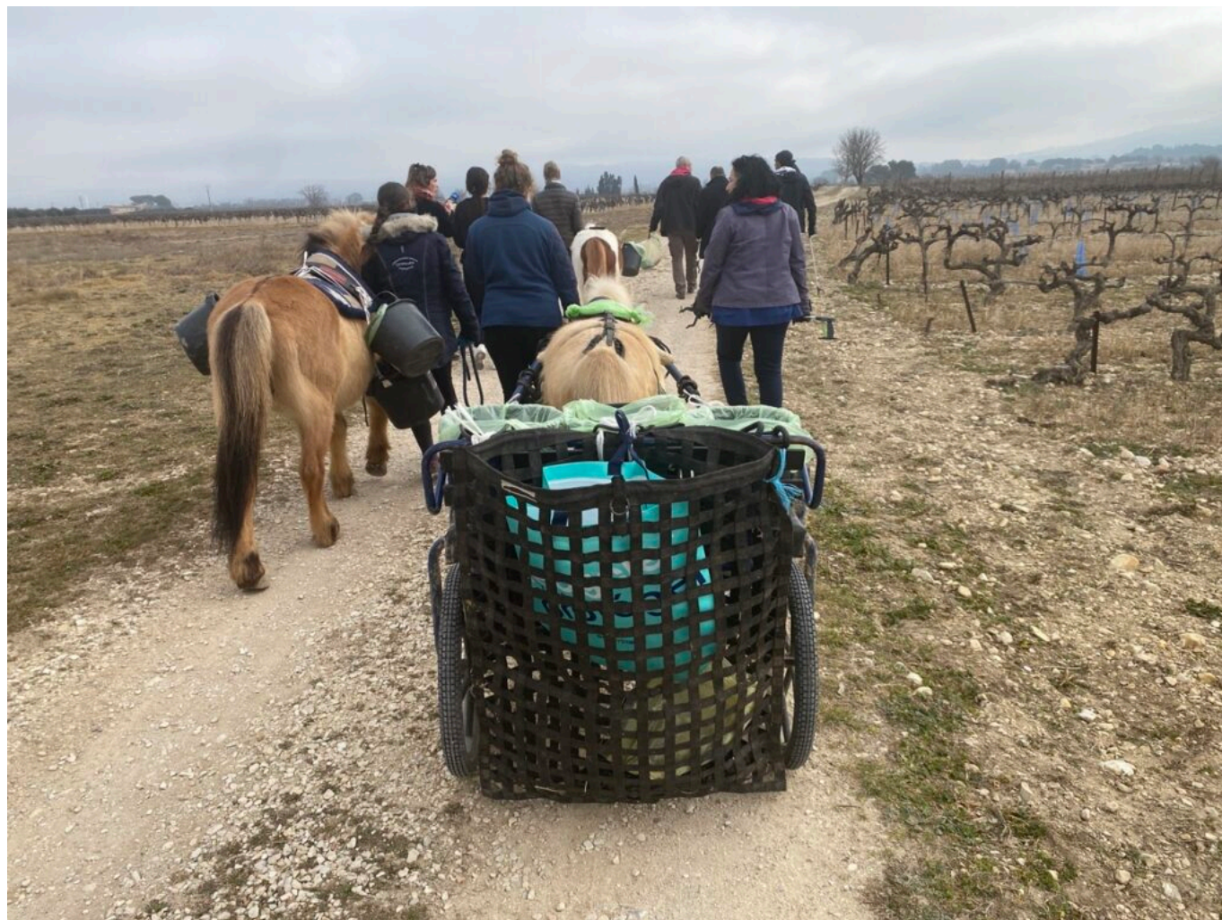
Le convoi de nettoyage mené par les poneys

Les trois jeunes âgés de 16 à 17 ans, encadrés par deux éducateurs de la PJJ ont ainsi nettoyé la nature pendant deux heures après avoir été informés des procédures de tri par deux agents de la Cove.