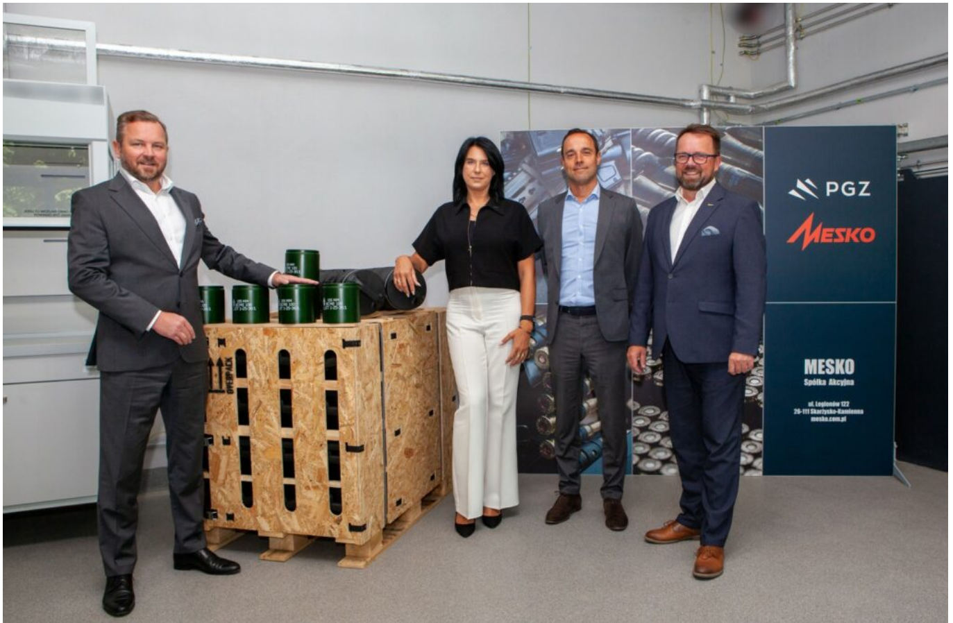
Les responsables de la société polonaise Mesko.