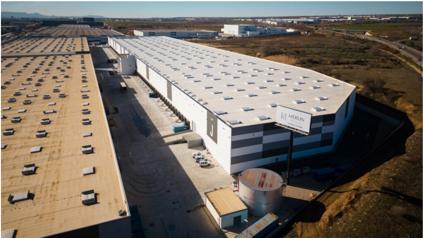
Nouvel entrepôt logistique pour MERLIN Properties à Madrid