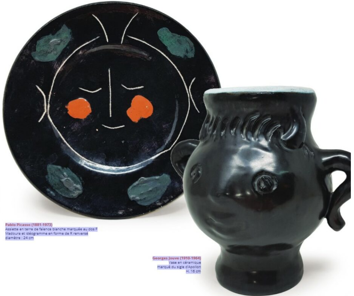
Pablo Picasso (1881-1973) Assiette en terre de faïence blanche marquée au dos F Madoura et idéogramme en forme de R renversé diamètre : 24 cm