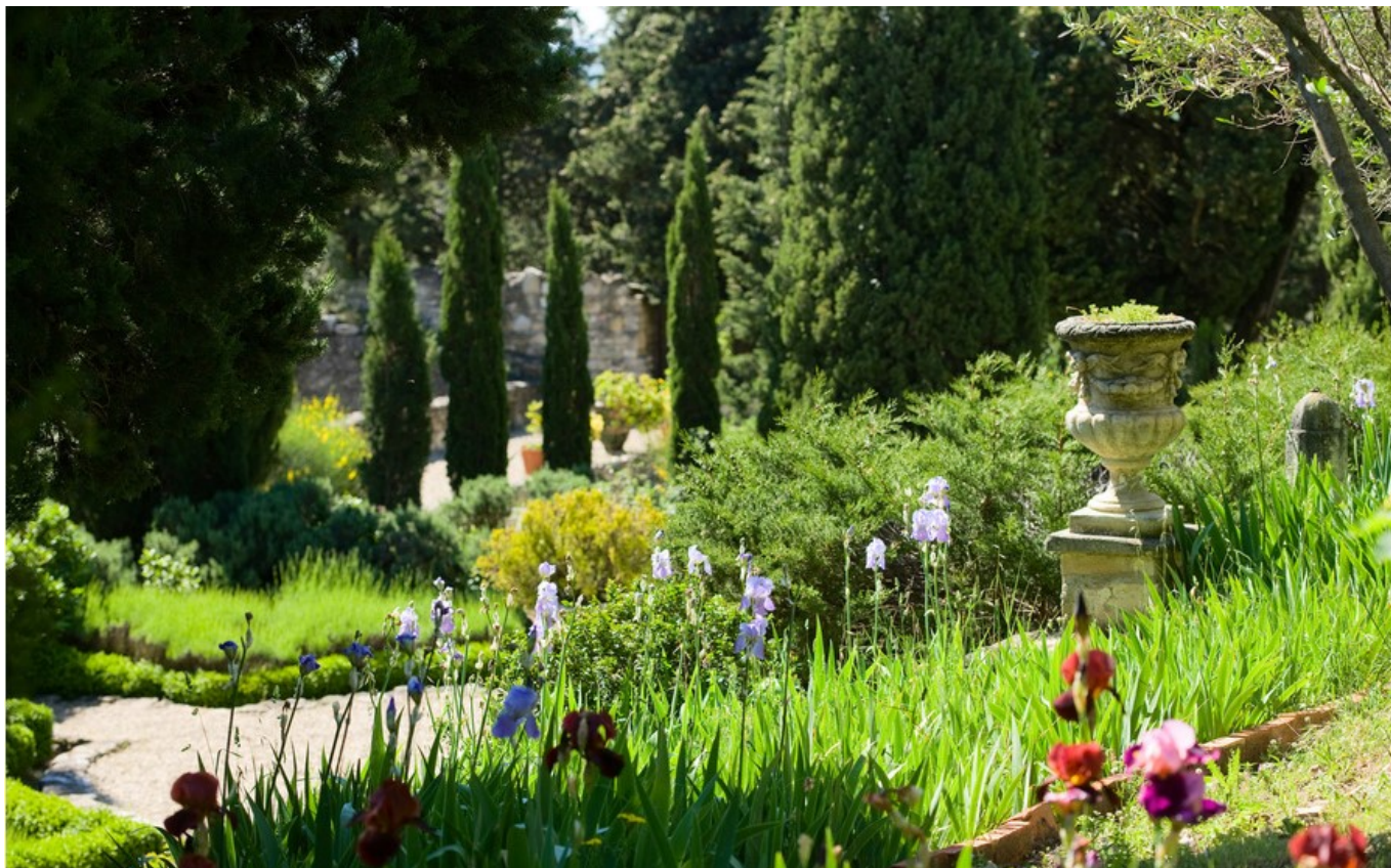
Les jardins de l'abbaye Saint-André