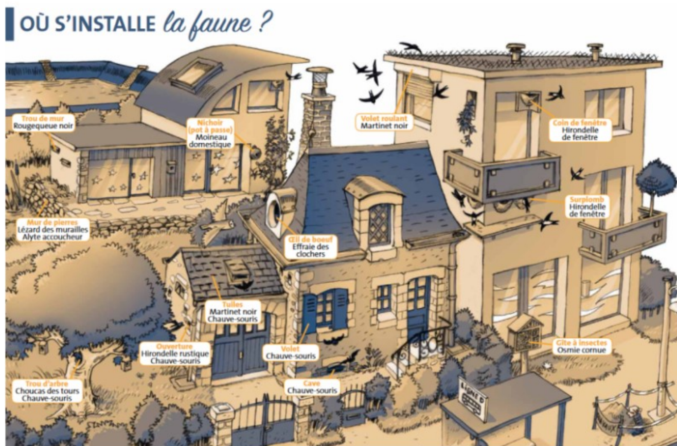
Illustration du Guide "Nature et bâti" © Loiret Nature Environnement