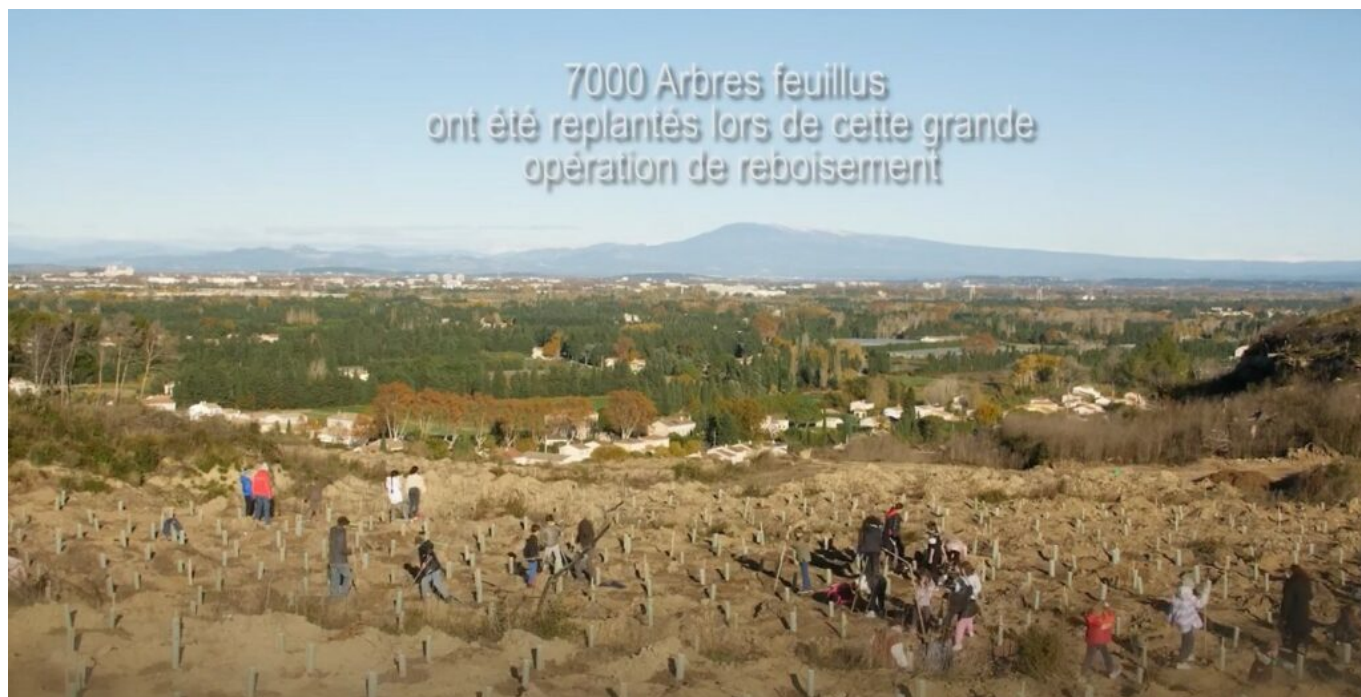
Replantation de 7 000 feuillus à la Montagnette

«A chaque fois que nous travaillons sur une route, nous refaisons les réseaux humides si nécessaire et enfouissons les réseaux secs comme Chemin du Colombier, Chemin de l'Hôpital, Chemin du Réchaussier, sous l'impasse de l'église et sous la place du marché, » a précisé le maire.