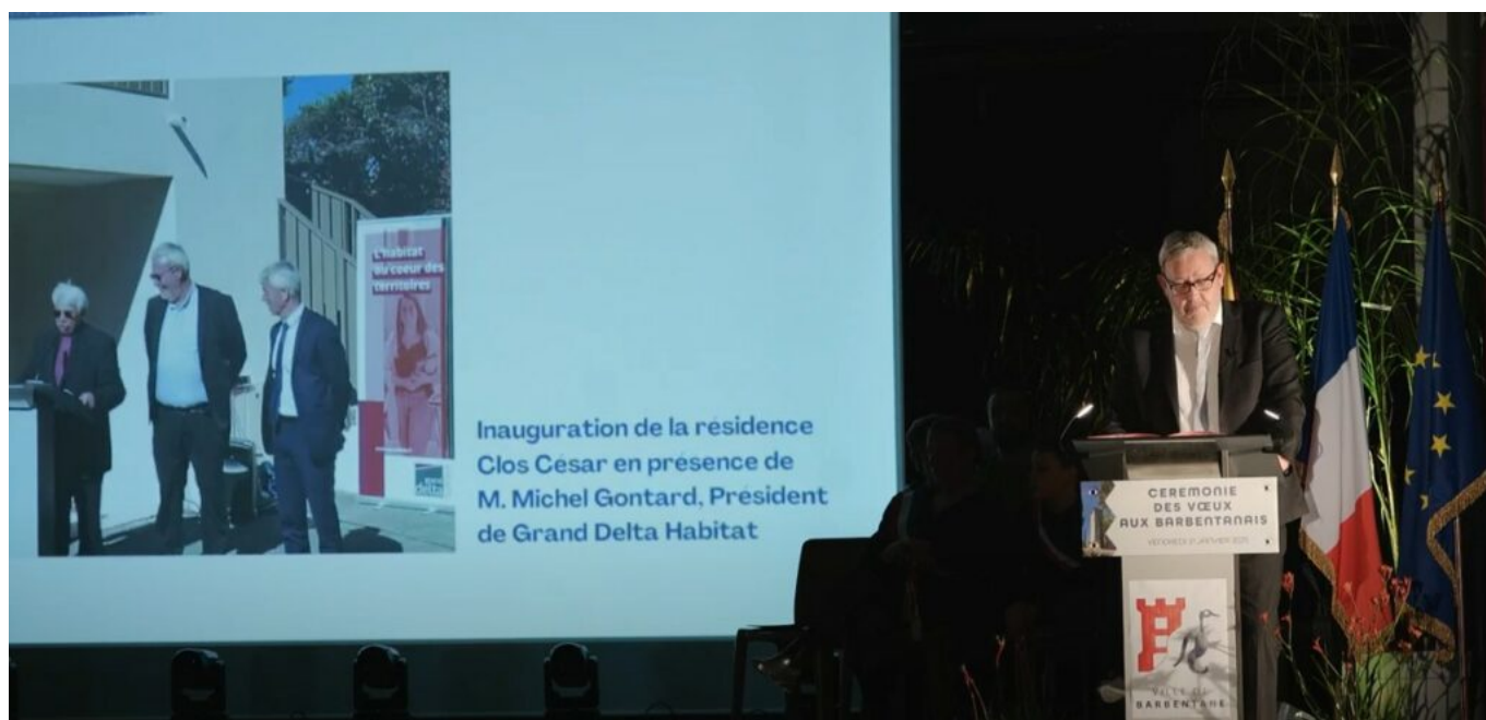
Inauguration du Clos César Résidence Grand Delta Habitat