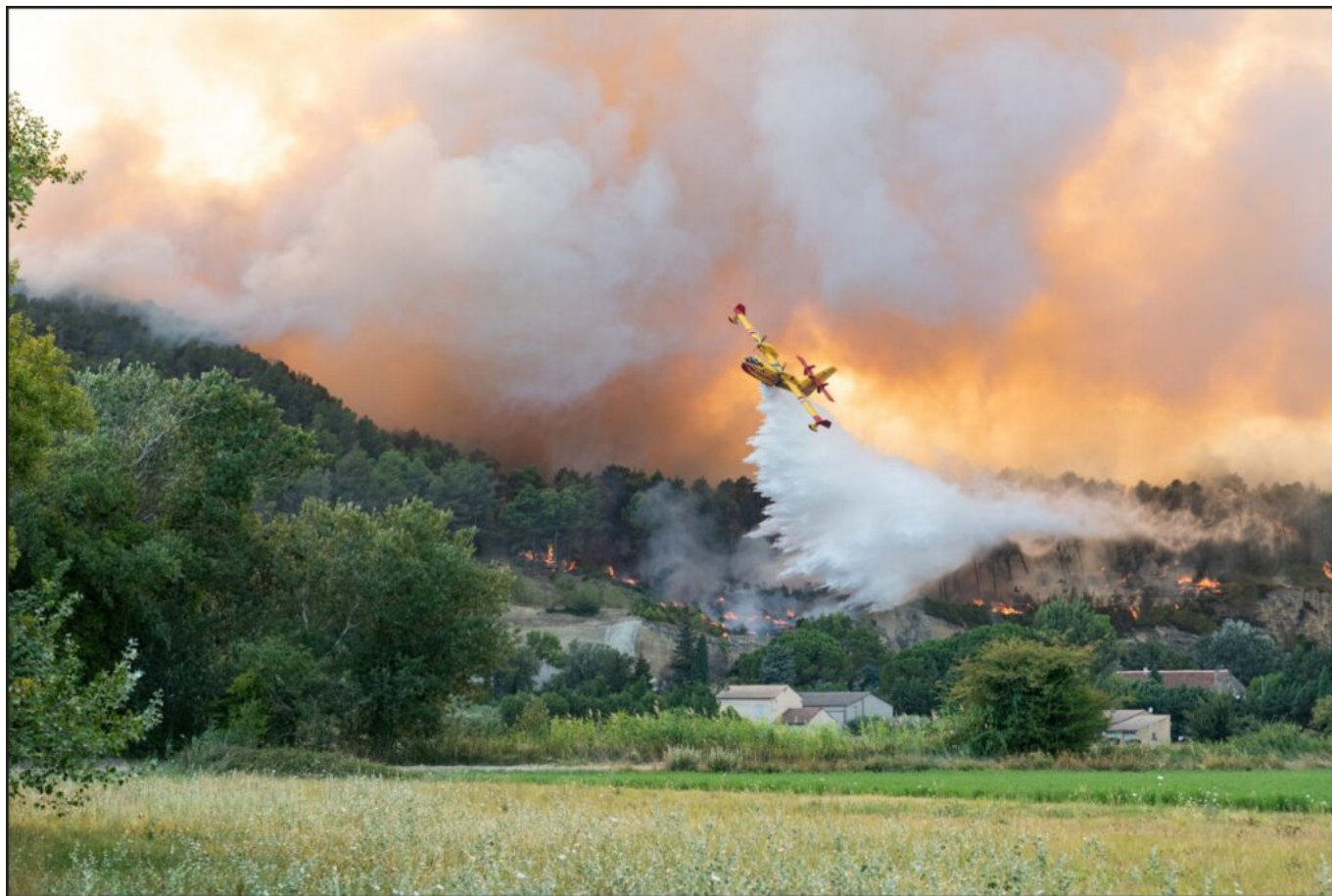
Intervention d'un Canadair sur la Montagnette à Barbentane