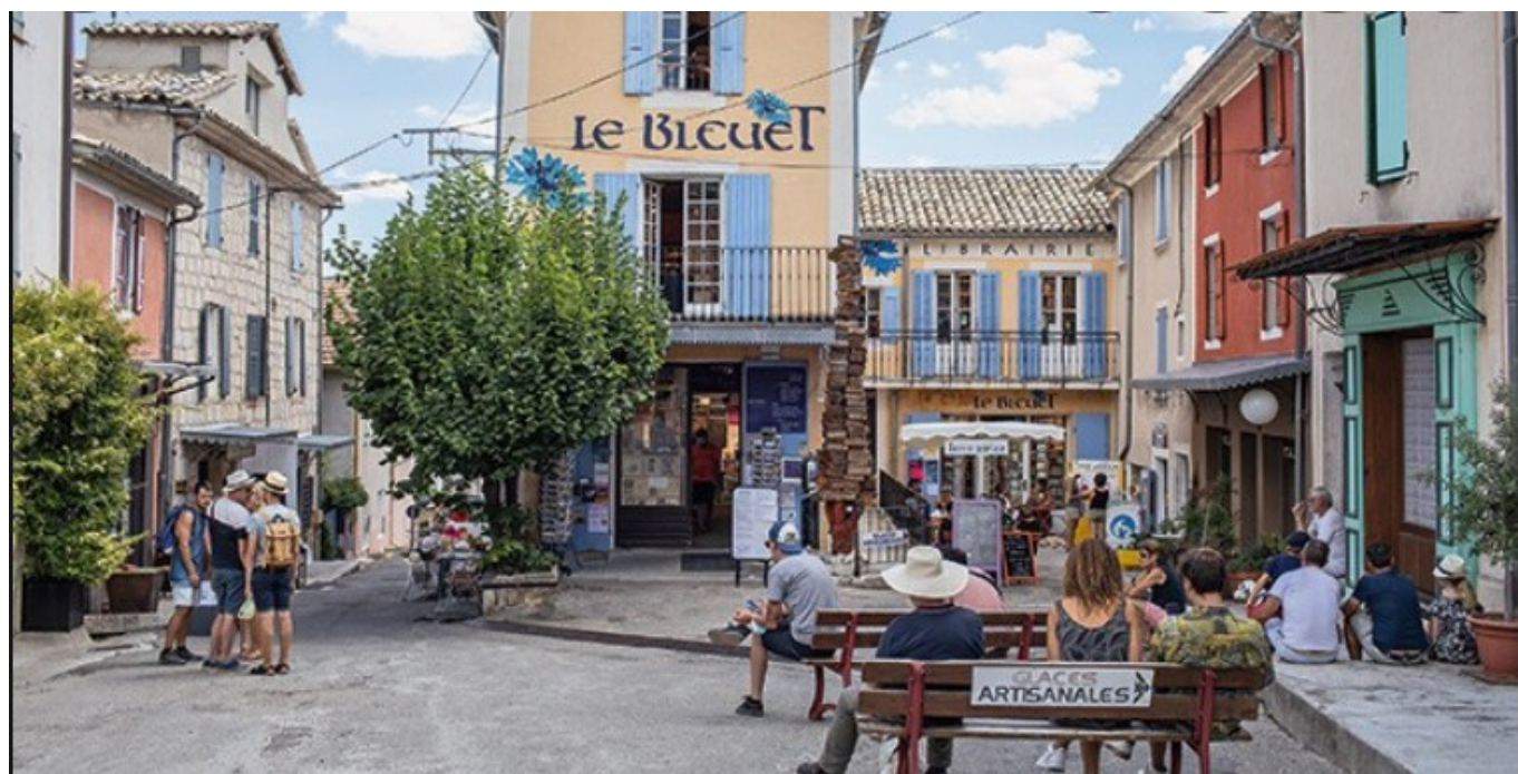
Librairie Le Bleuët à Banon

Le Festival des Oralies, nocturne de contes continue ce jeudi 4 août à 20h. Venez entendre 'L'amour du conte' par le conteur et auteur Jihad Darwiche au gré de 'Sagesse et malices de Nasreddine ; Le fou qui était sage'. Des histoires pour tous les âges pleines de saveur et de sagesse. Les Oralies ont lieu jusqu'au 15 août. Toujours à la Librairie Le Bleuët à Banon.