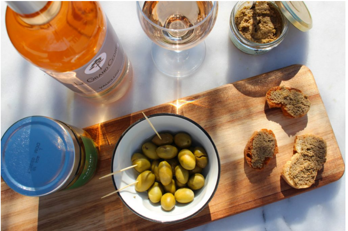
Piquez dans l'assiette.