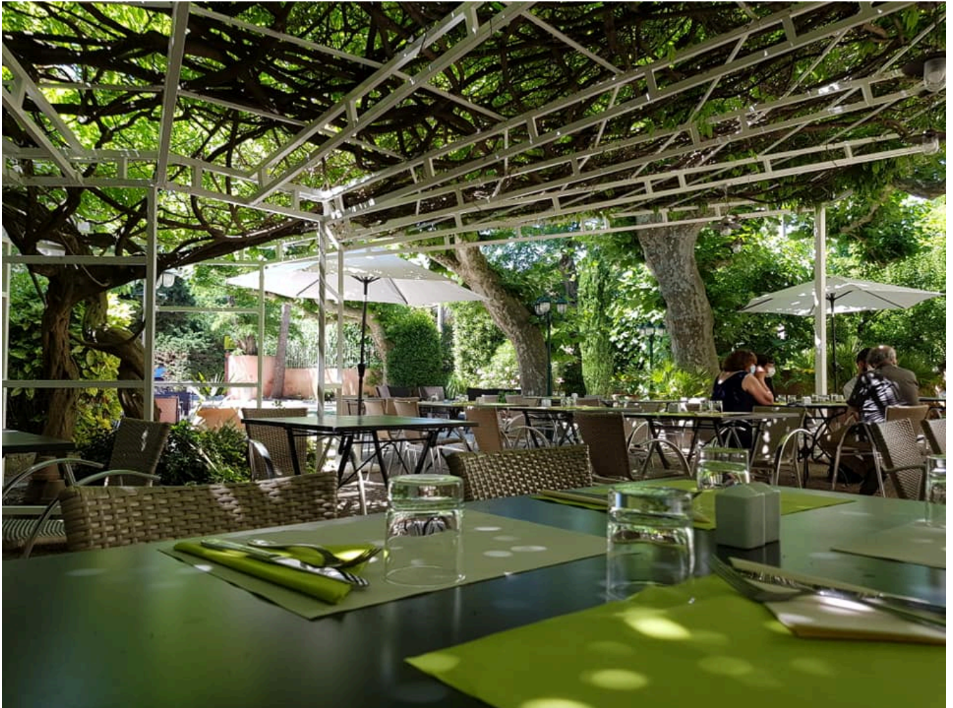
Photo: hôtel restaurant 3 étoiles 'La ferme'