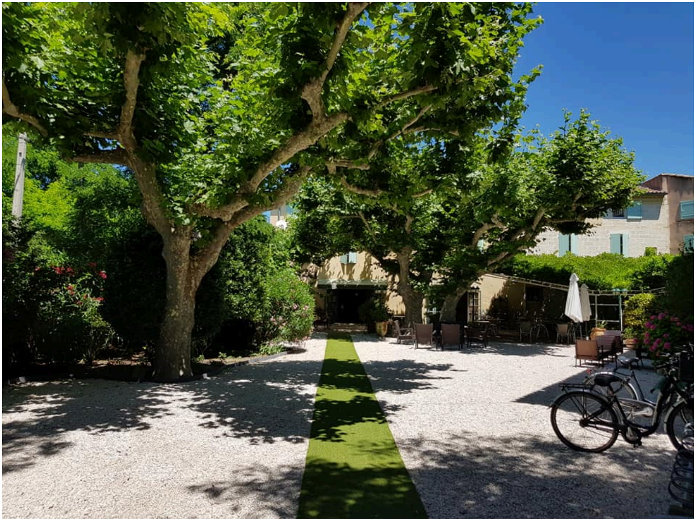
Photo: hôtel restaurant 3 étoiles 'La ferme'