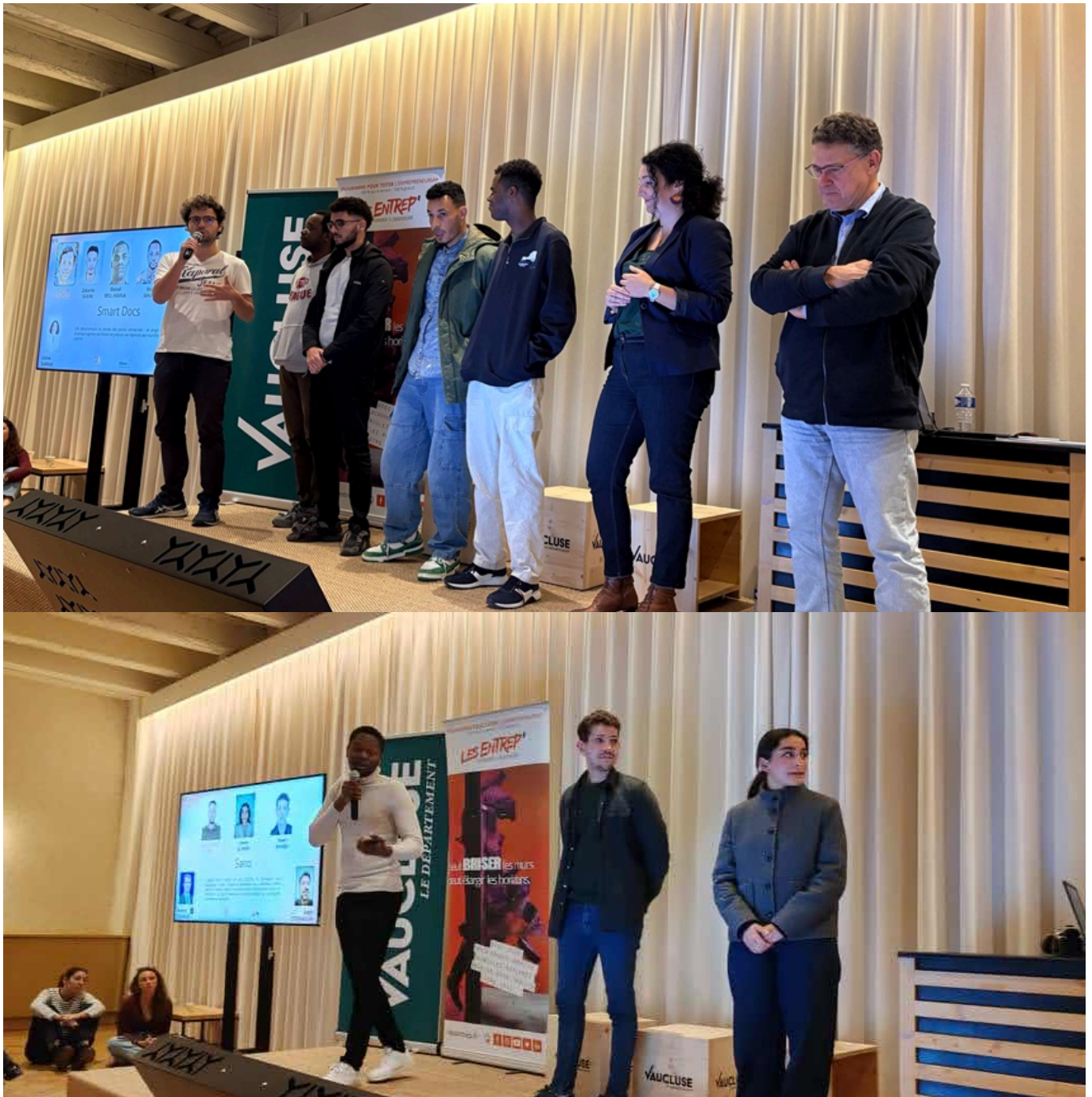
Une partie des équipes de la promo 2026 des Entrep' Vaucluse.