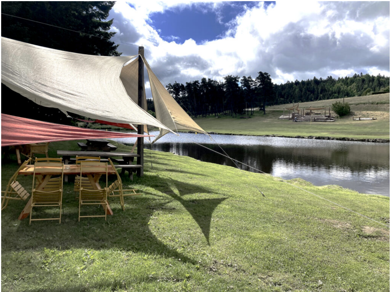
Au bord du plan d'eau alimenté par le Lignon.