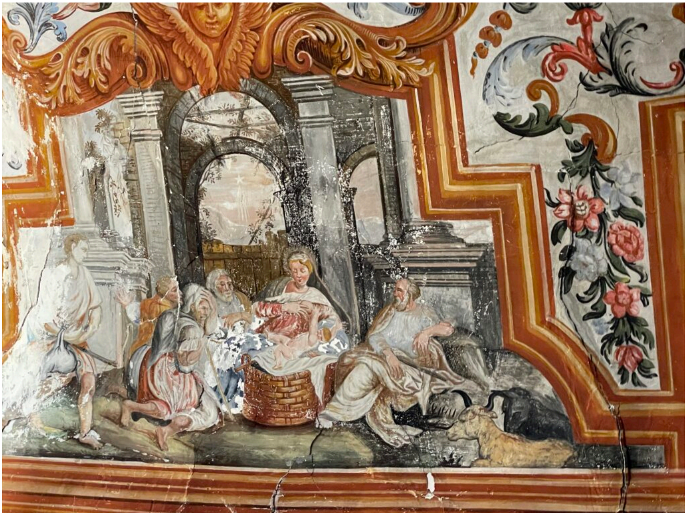
Détail d'une fresque de la chapelle Notre dame la Brune