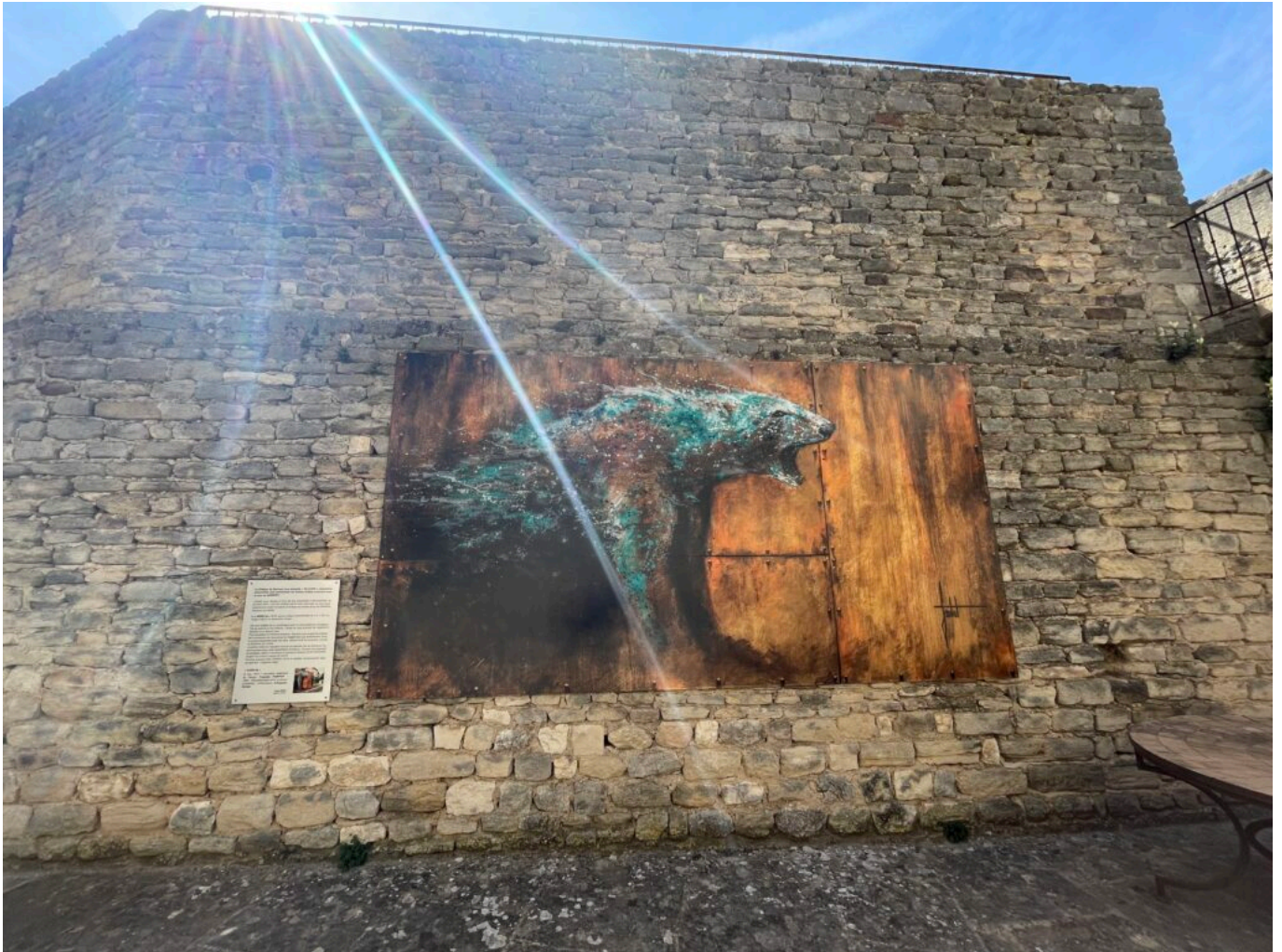
Œuvre de Sandrot Copyright MH sur un mur d'une cour du Château du Barroux