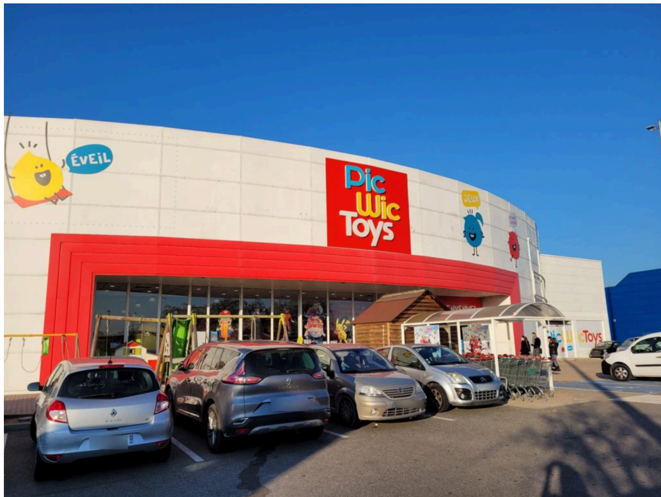
'PicWicToys' Avignon, zone commerciale Avignon Nord, Av. Jules Verne.

l'ours. Sans compter les intemporels : Barbie, figurines, jeux de société qui ont ressurgi dans le sillage des confinements. Mattel, Vtech, Hasbro, ils forment les fournisseurs historiques de l'enseigne qui propose également des jouets sous sa propre marque, présents dans tous les univers.