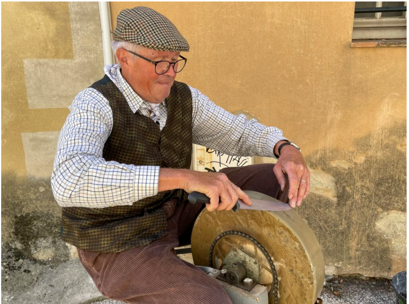
Le Rémouleur

11h30-12h30 Théâtre Le lavoir, au lavoir, 12h-14h30 Restaurant le Jardin, au jardin de l'église, 13h-18h, Jeux en bois avec l'association Oser, Place de l'église, 13h30-17h30, Manège des enfants et animation, avec la Compagnie Lune à l'autre, à la Tour des Mascos 14h30-16h Ballade commentée du Vieux village, départ depuis la Tour des Mascos, 14h30-16h30 Cuisson des pains et des brioches et vente par le Petit gourmand, au Four banal, rue de la République, 15h-16h, dernière représentation de la pièce de théâtre Le lavoir au lavoir, 15h-17h Dessin d'après nature, initiation gratuite par Serge Le Cun, dans les rues et les calades, 16h-17h Francis Cauli raconte des contes aux enfants dans le jardin du presbytère, 17h45-18h45, concert de clôture par le Trio Mare Nostrum Musicae à l'église. www.lesamisduvieuxvillagedesangles.fr