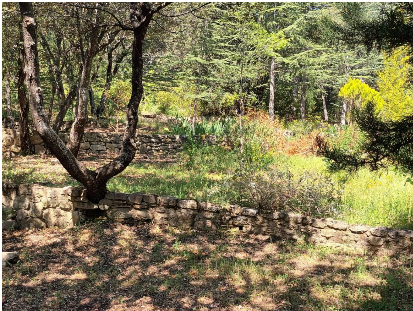
Le parc de Georges à Vaugines