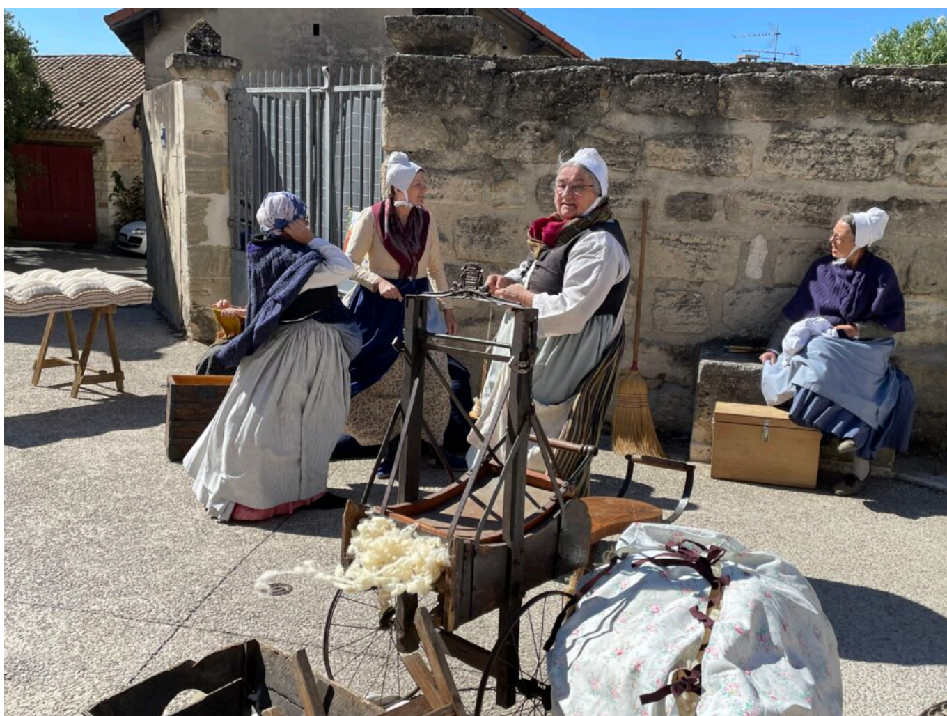
Cardage de la laine, fabrication de matelas