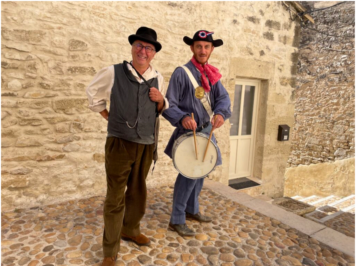
Un Anglois du siècle dernier et le garde-champêtre du village

doute que cette journée va faire basculer leur destin avec la déclaration de ce que l'on nommera, plus tard, la Grande Guerre. Quatre beaux portraits de femmes, servis par un texte vif et poétique, un vrai régal pour les comédiennes comme pour les spectateurs. La mise en scène est de Bertrand Beillot et le régisseur est Christian Rollot.