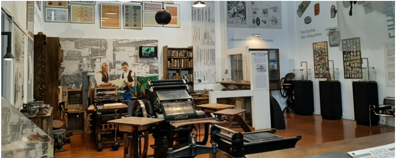
Musée du cartonnage à Valréas

Samedi à 11h, sur inscription au 04 90 35 58 75.