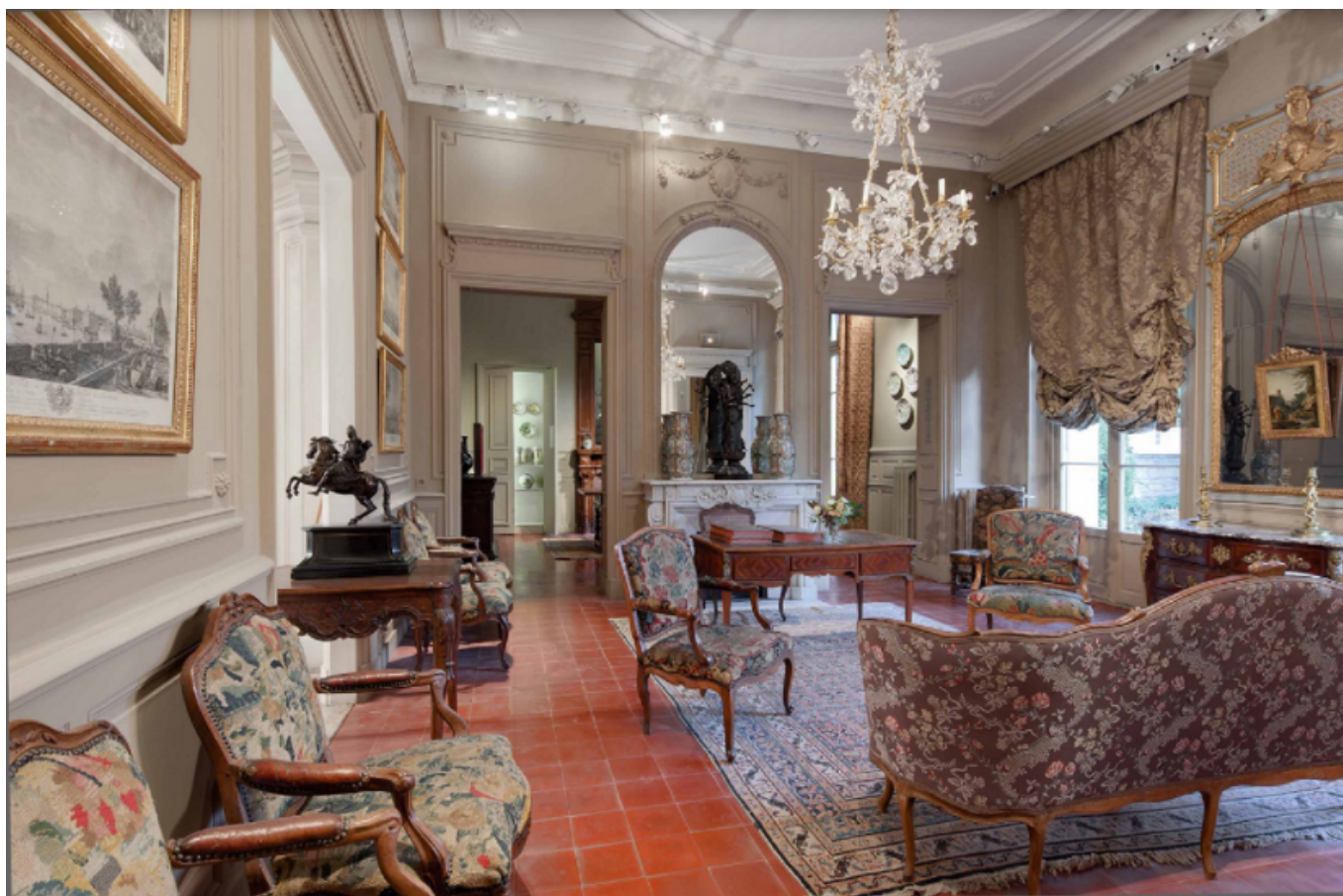
Le Musée Vouland, un lieu inspirant

Elle aura lieu le mercredi 22 septembre. Objectif ? faire découvrir aux enseignants, de la maternelle au lycée ainsi qu'aux animateurs de temps périscolaire ou de centres sociaux les collections d'arts décoratifs XVIIe et XVIIIe siècles, de peinture régionale des XIXe et XXe siècles, la vie du jardin, les différentes approches thématiques développées au musée, les possibilités d'interventions dans les établissements scolaires... Ces rencontres permettent aussi de préciser ou définir des projets pédagogiques spécifiques. Renseignements et inscriptions : 04 90 86 03 79 ou communication.museevouland@gmail.com