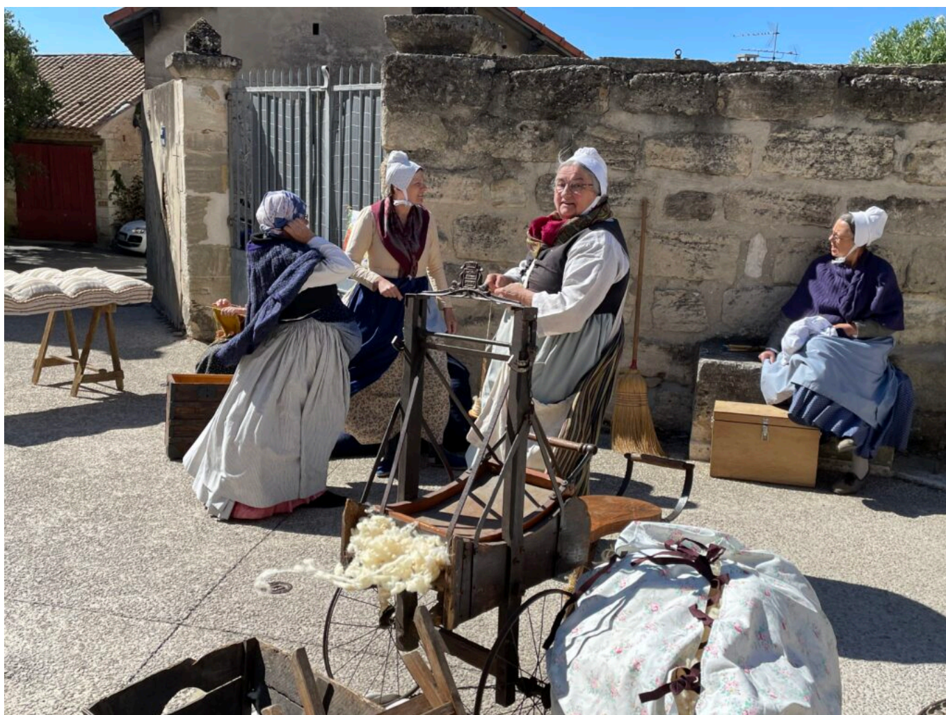
Cardage de la laine, fabrication de matelas