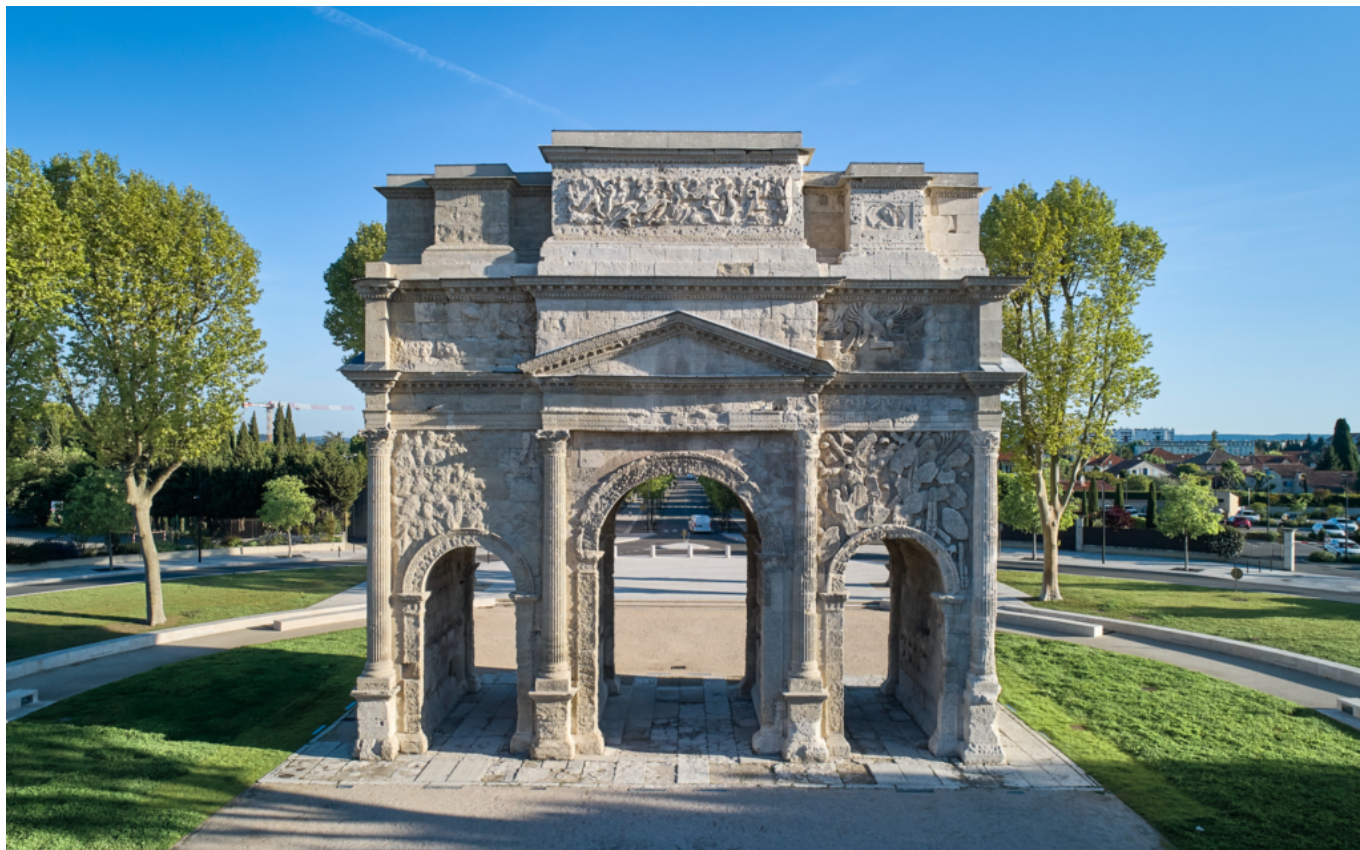
Arc de triomphe d'Orange