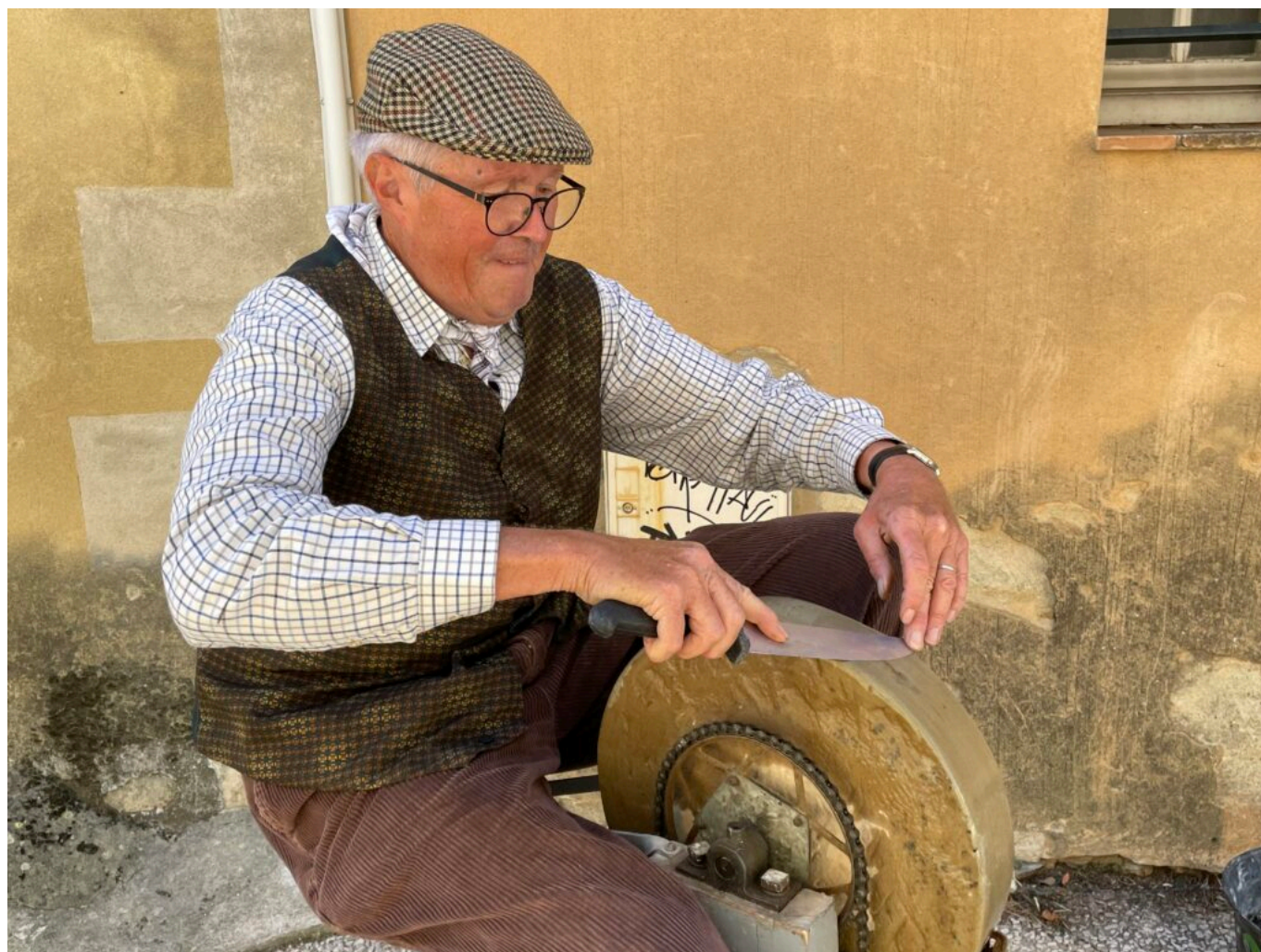
Le Rémouleur

11h-12h30 Ballade commentée du vieux village depuis la Tour des Mascos, 11h30-12h30 Théâtre Le lavoir, au lavoir, 12h-14h30 Restaurant le Jardin, au jardin de l'église, 13h-18h, Jeux en bois avec l'association Oser, Place de l'église, 13h30-17h30, Manège des enfants et animation, avec la Compagnie Lune à l'autre, à la Tour des Mascos 14h30-16h Ballade commentée du Vieux village, départ depuis la Tour des Mascos, 14h30-16h30 Cuisson des pains et des brioches et vente par le Petit gourmand, au Four banal, rue de la République, 15h-16h, dernière représentation de la pièce de théâtre Le lavoir au lavoir, 15h-17h Dessin d'après nature, initiation gratuite par Serge Le Cun, dans les rues et les calades, 16h-17h Francis Cauli raconte des contes aux enfants dans le jardin du presbytère, 17h45-18h45, concert de clôture par le Trio Mare Nostrum Musicae à l'église. www.lesamisduvieuxvillagedesangles.fr