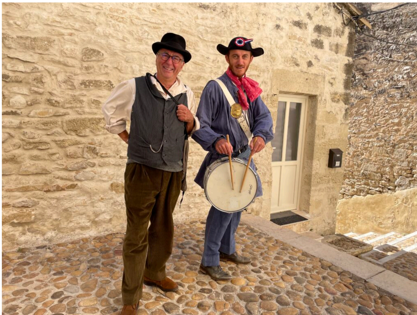
Un Anglois du siècle dernier et le garde-champêtre du village

doute que cette journée va faire basculer leur destin avec la déclaration de ce que l'on nommera, plus tard, la Grande Guerre. Quatre beaux portraits de femmes, servis par un texte vif et poétique, un vrai régal pour les comédiennes comme pour les spectateurs. La mise en scène est de Bertrand Beillot et le régisseur est Christian Rollot.