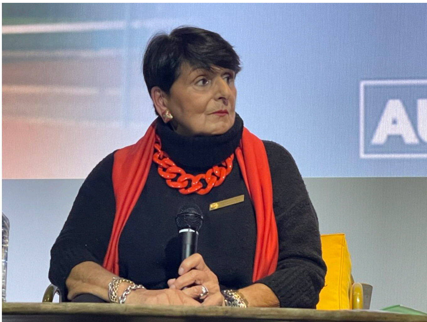
Michèle Michelotte Copyright MMH

«Il se renferme, physiquement et moralement, observe la professeure. Il se tait et peut même souffrir de phobie scolaire. Un matin, il se lève et ne peut pas affronter l'école. Pas parce qu'il a de mauvais résultats, c'est même souvent l'inverse, parce qu'il réussit trop bien et cela ne plaît pas au groupe. Physiquement, cela peut se traduire par des enfants qui vont arrêter de grandir, comme s'ils voulaient se mettre en retrait, s'effacer, être le plus discrets possible, un peu disparaître.»