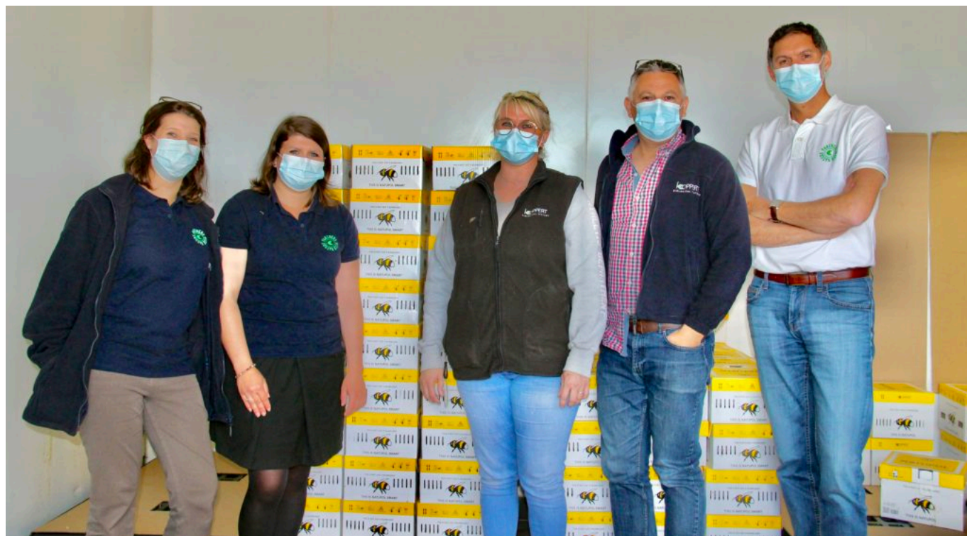
L'équipe logistique est renforcée pour un meilleur service.

Implantée à Cavaillon depuis 1984, le groupe compte 55 collaborateurs en France : 35 personnes basées au siège cavare et dans ce nouvel entrepôt logistique, ainsi qu'une vingtaine dans ses agences d'Agén, de Nantes et de Villeneuve l'archevêque dans l'Yonne. La filiale française a réalisé un chiffre d'affaires de 15M€ l'an dernier. Le groupe Koppert regroupe plus de 1 700 salariés pour un chiffre d'affaires monde de 265M€ en 2019.