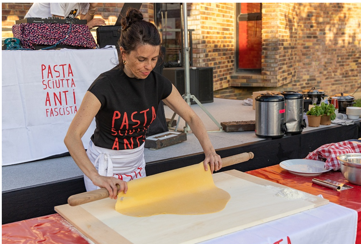
'La Pastasciutta antifascista de Casa Cervi'.