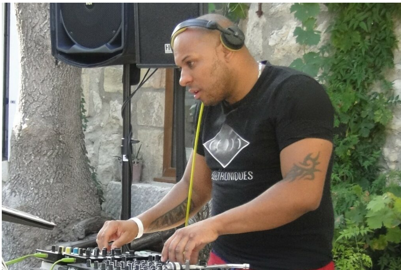
Will Row © DR.