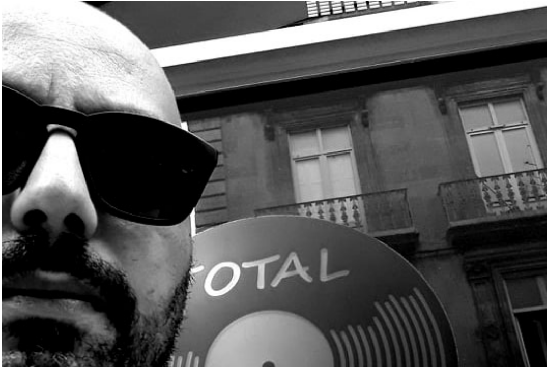
Nacime B

Pour écouter Nacime B, cliquez sur ce lien .