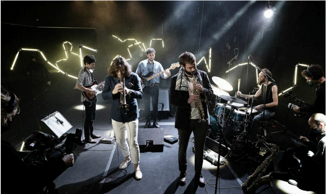
Go to the dogs