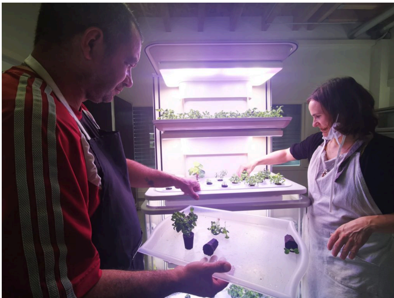
Chaque plante est méticuleusement testée.