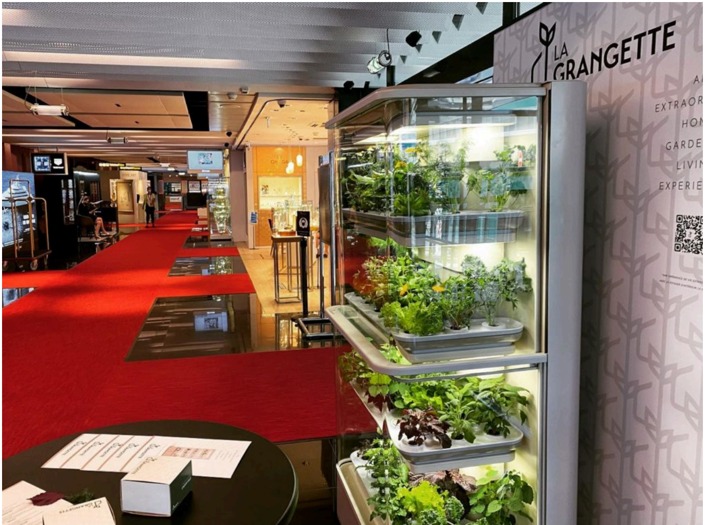
Exposition au terminal d'affaires de Nice.