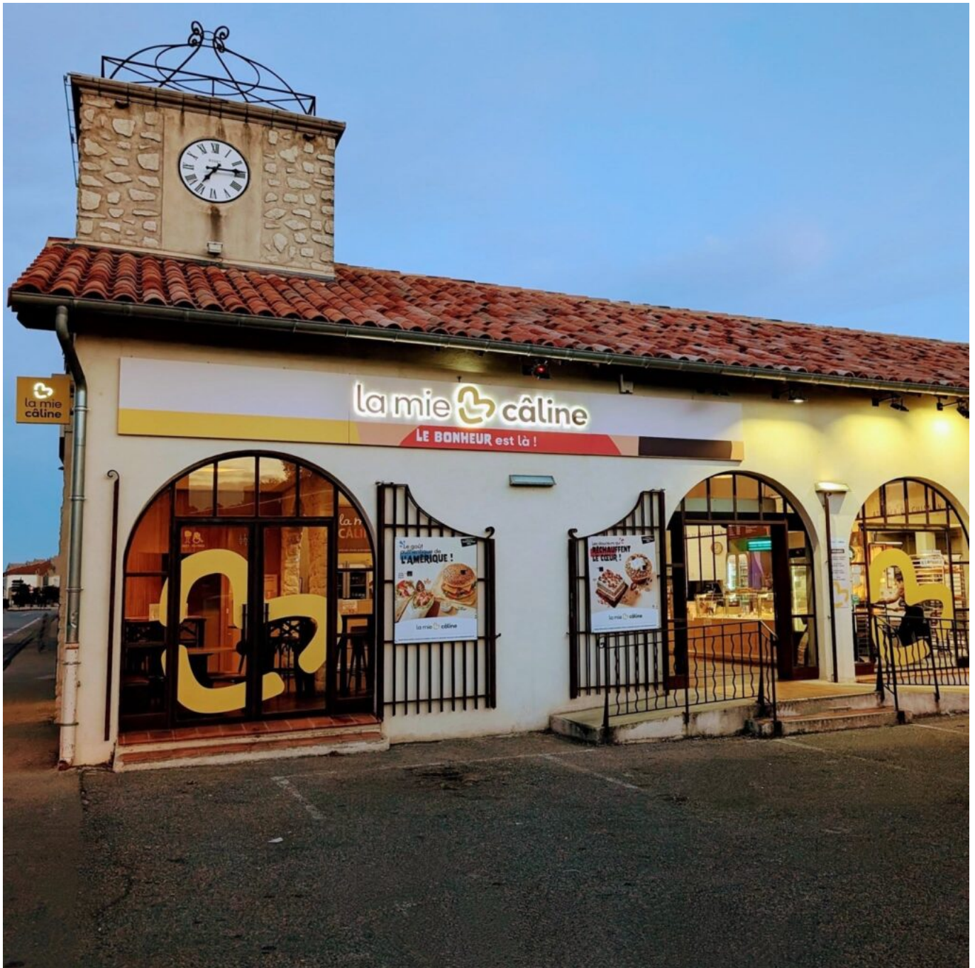
Le magasin cavaillonnais.