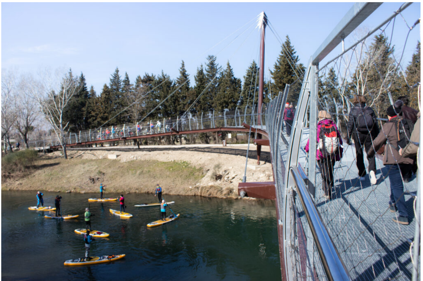
La passerelle himalayenne de Sorgues enjambant l'Ouvèze

La passerelle contribue à promouvoir les modes doux de déplacement, une nouvelle liaison entre certains quartiers isolés du centre-ville de Sorgues et de l'Ouvèze qui joue un rôle de frontière naturelle. Elle a également pour objet de développer l'attractivité du centre-ville et de redynamiser le commerce, de booster l'attractivité touristique, notamment via la fréquentation de la voie Rhôna, et, surtout, d'accroître, au quotidien, la qualité de vie des habitants et visiteurs.