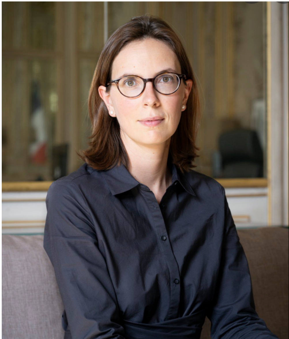
Amélie de Montchalin, Ministre de la transformation et de la fonction publiques

concrètement aux besoins quotidiens des usagers ?»