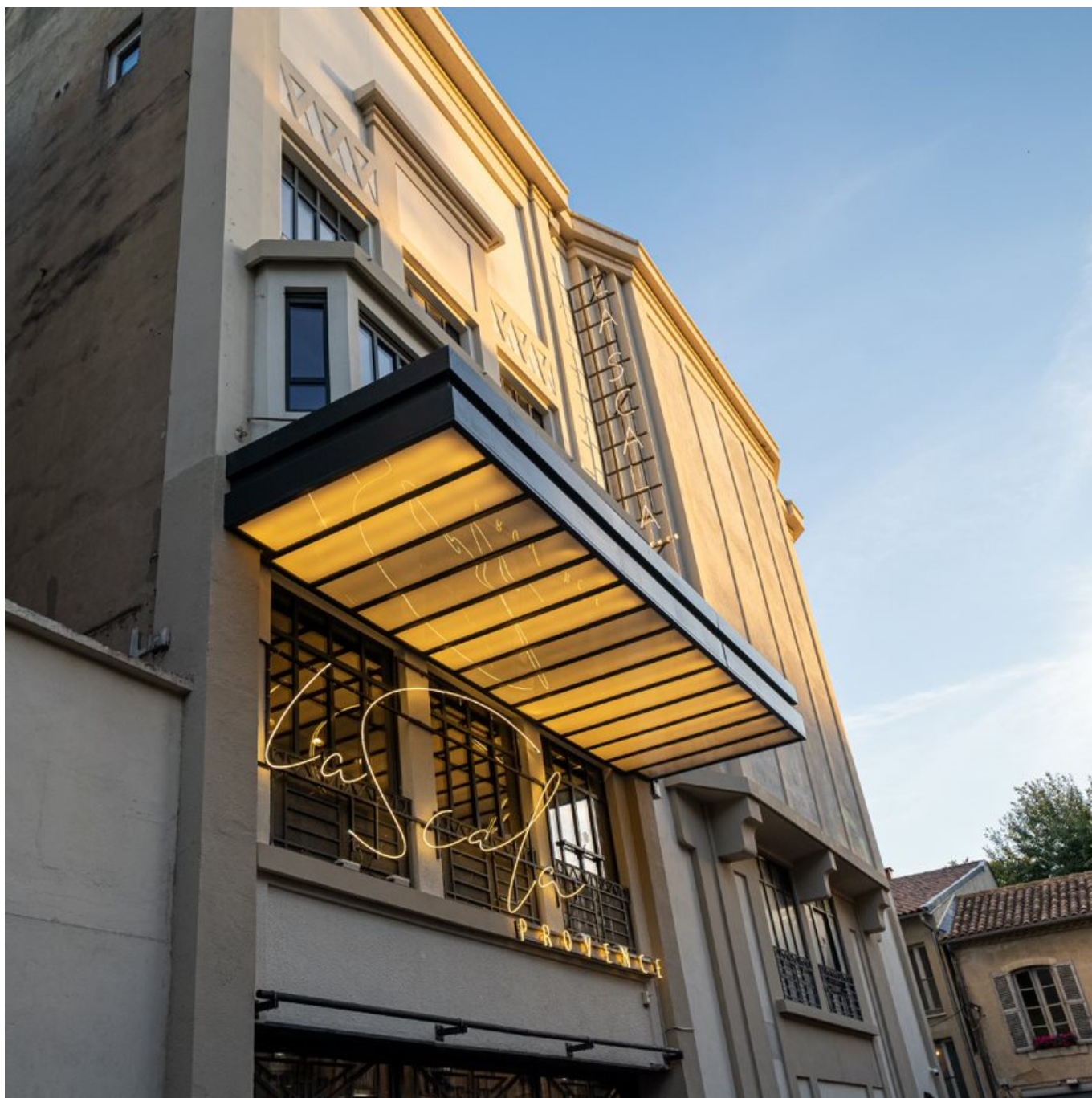
La Scala Provence