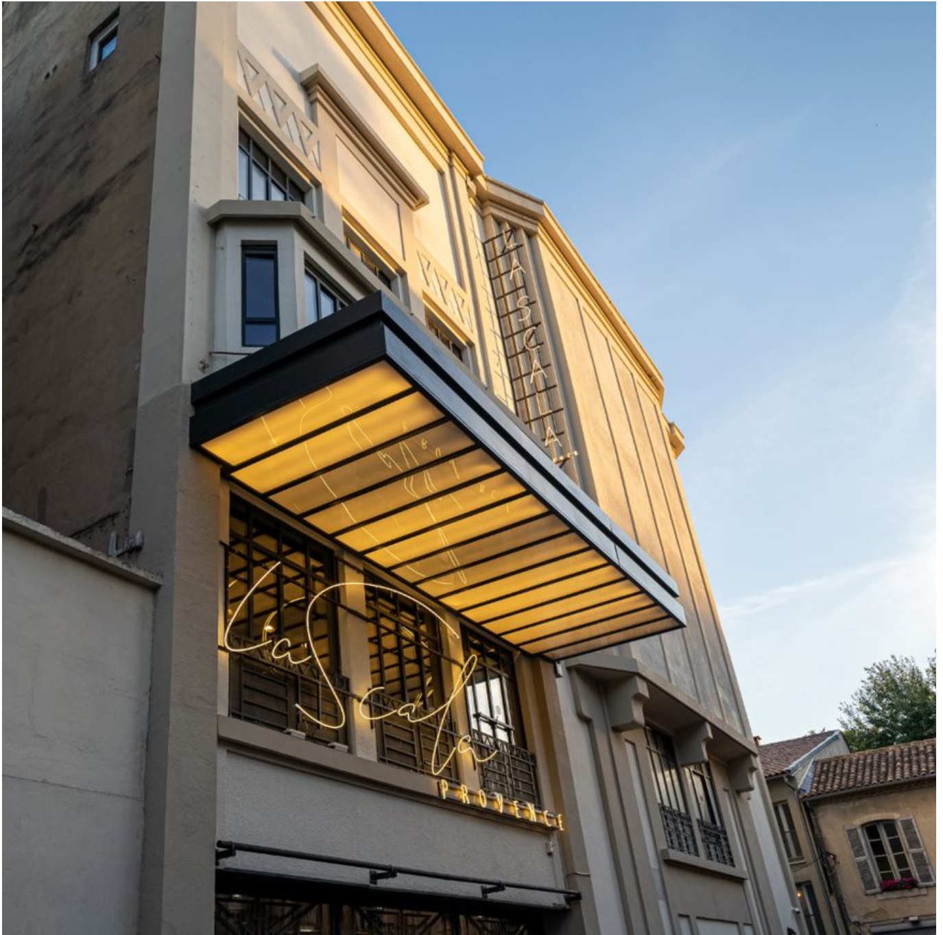
La Scala Provence