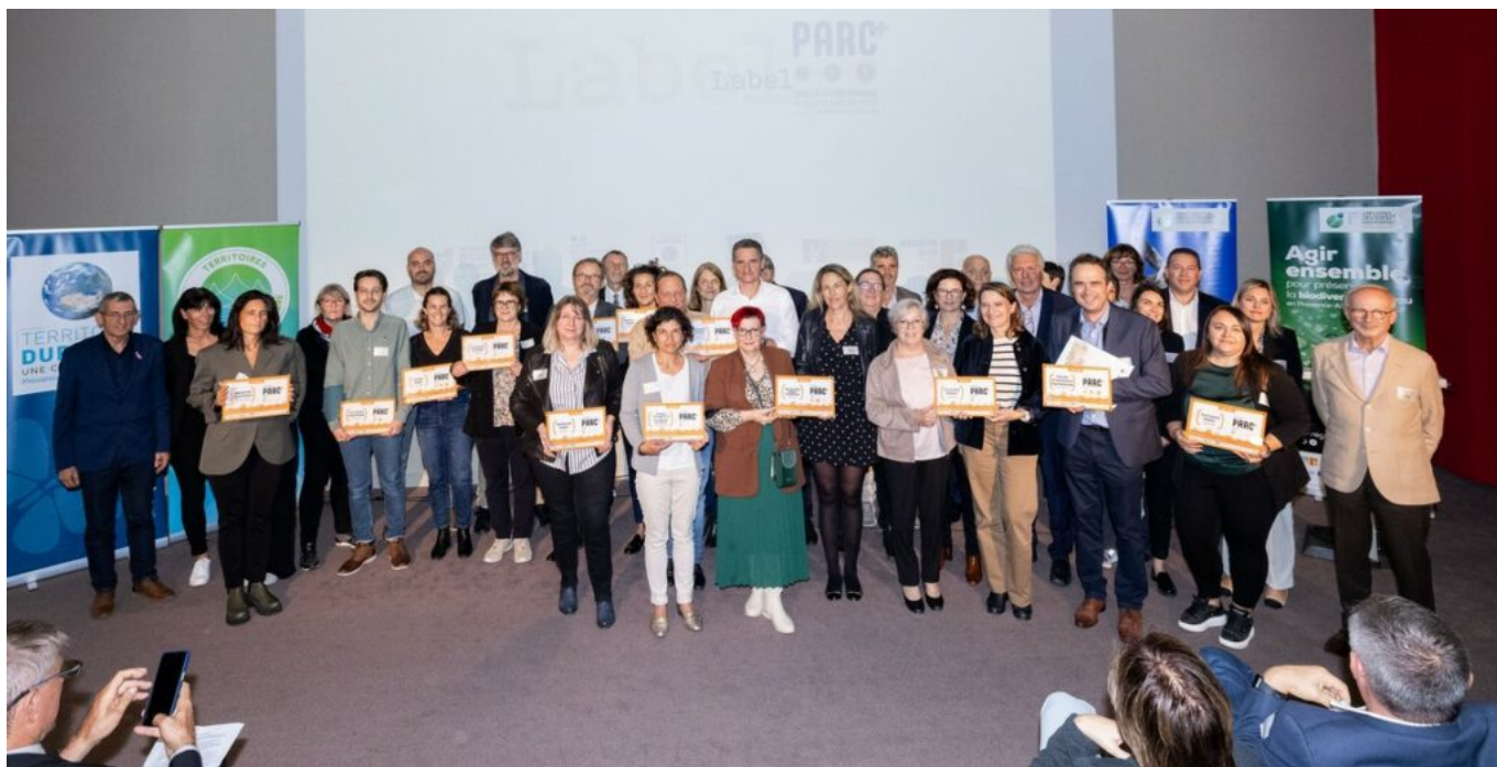
Les lauréats du label+.

d'Apt-Ouest, de la Grange Blanche à Courthézon, du Pôle d'activités Piol à Mazan ainsi que le pôle aéronautique Pégase à Avignon et le MIN (Marché d'Intérêt National) d'Avignon