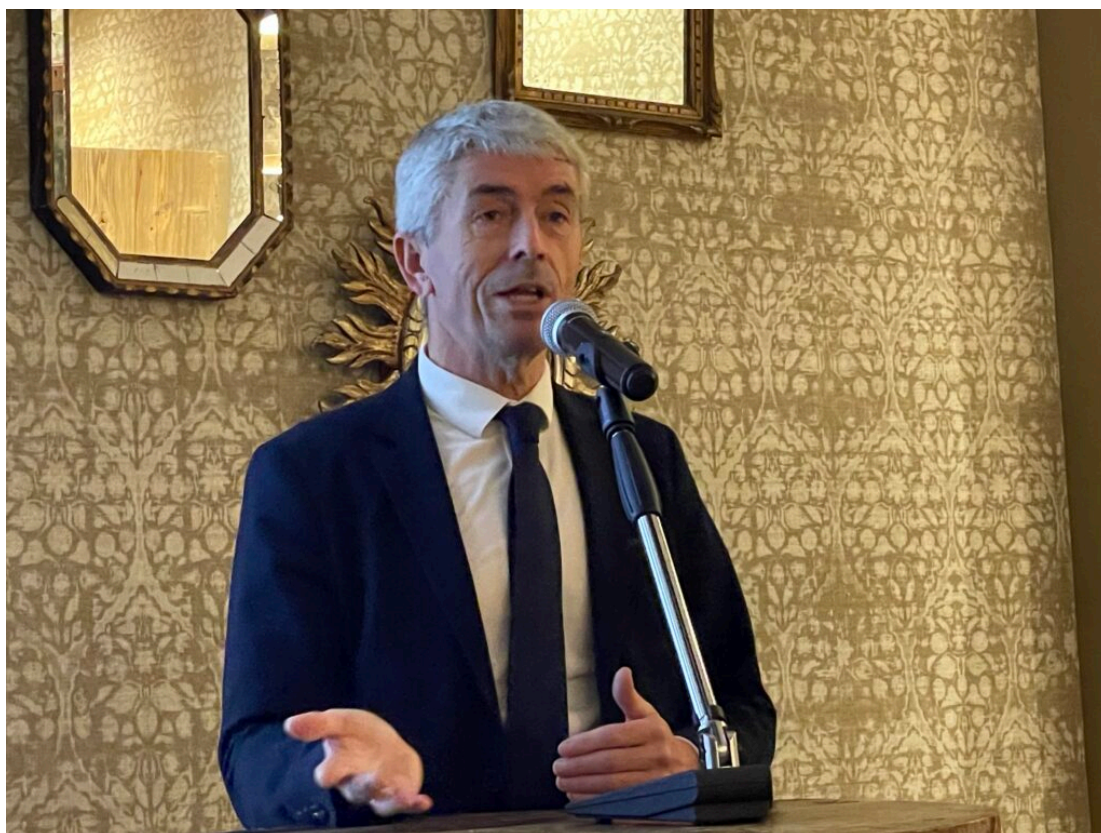
Xavier Sordelet Copyright MMH