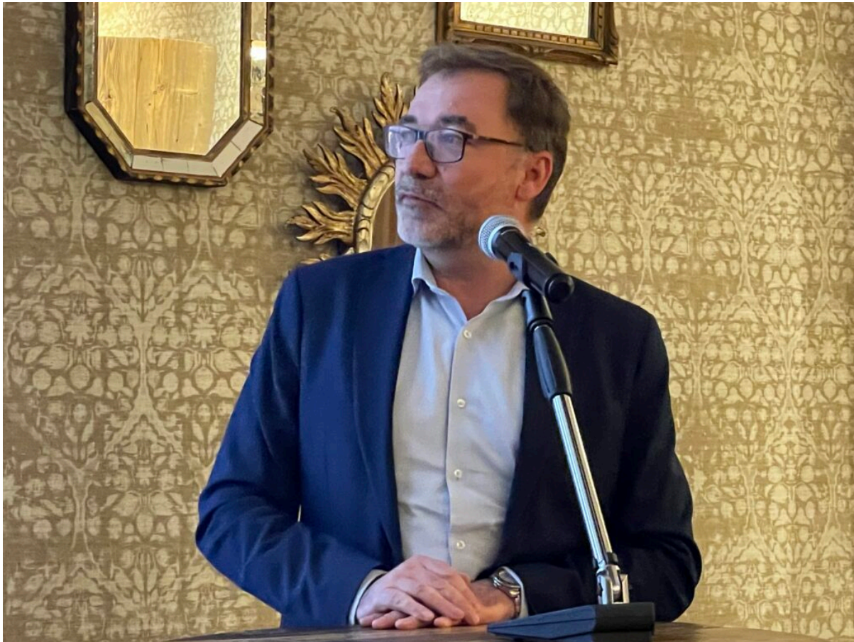
Nicolas Rocuet Copyright MMH

«La coopérative vise 1 000 logements réhabilités poursuivait Xavier Sordelet, 500 logements livrés, 78 livraisons en accession à la propriété et 66 terrains à bâtir. Nous pensons racheter beaucoup de patrimoine. Comme en 2024, notre objectif sera de faire plus avec les mêmes moyens.»