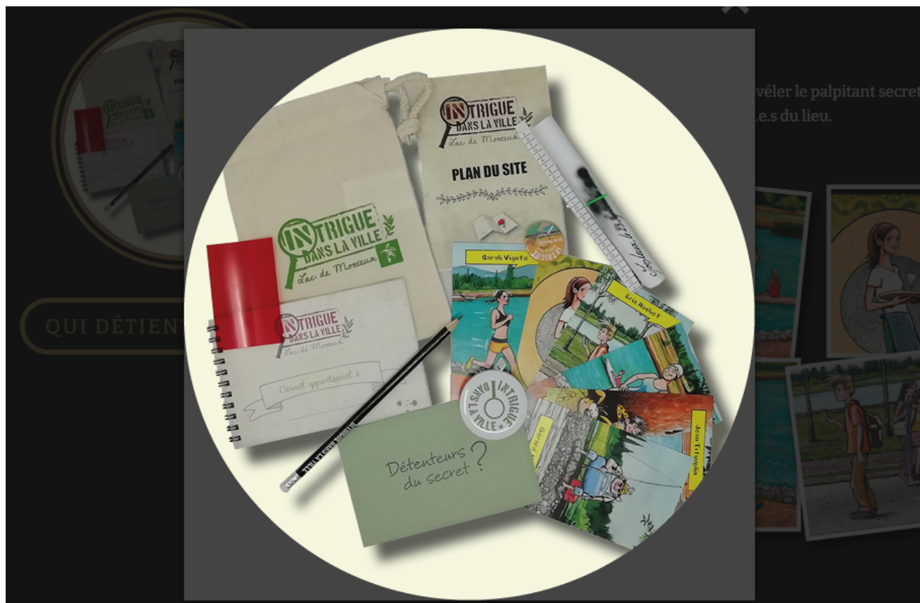
Intrigue dans la ville