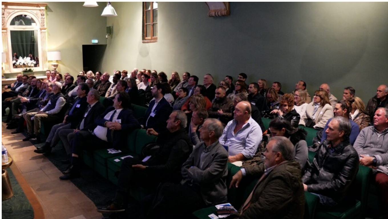
Salle comble pour la 1 re Nuit de commerce de proximité.