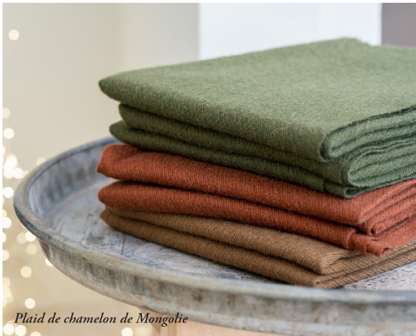
Plaid de chameau de Mongolie