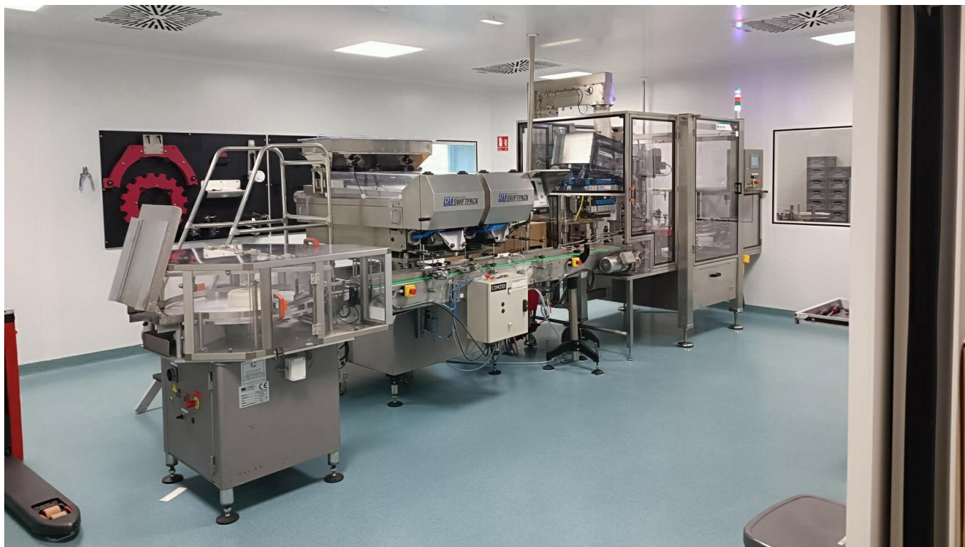
Chaîne de production Keriens 3