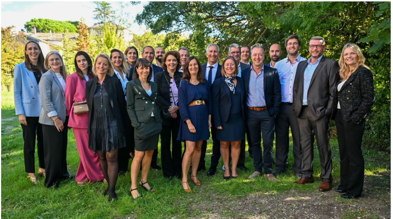
l'équipe Mayoly de l'Isle sur la Sorgue.

travaux. Un délai tellement rapide qu'il n'a pas permis à l'entreprise de pouvoir candidater à des éventuelles aides publiques... Autre fait marquant Mayoly qui se veut exemplaire dans sa démarche RSE a fait le choix de rénover un ancien bâtiment (anciennes filatures de l'Isle-sur-la-Sorgue), nous épargnant par la même occasion la construction d'un énième et hideux hangar industriel qui font légion aujourd'hui. Au terme de la montée en charge de la production de cette nouvelle ligne, c'est à dire début 2026, 10 emplois auront été créés.