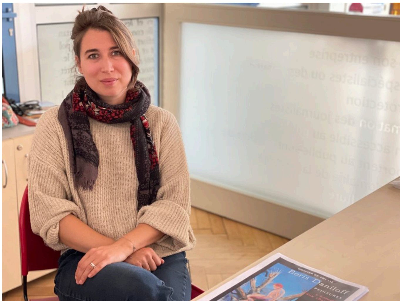
La réalisatrice Avignonnaise Florine Clap