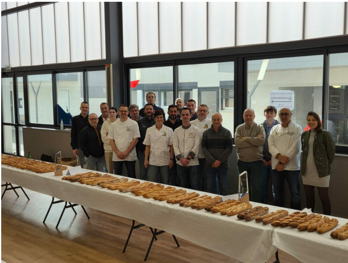
Le jury.

Pour la baguette de tradition, les participants ont été jugé d'après l'aspect de la baguette, sa croûte, sa mie, son goût et sa mâche. Pour le flan, le visuel, la cuisson, la texture, ainsi que le goût étaient pris en compte pour départager les meilleurs.