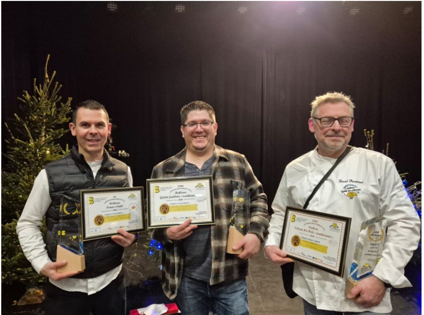
Les trois artisans qui ont remporté les 1ers Prix.