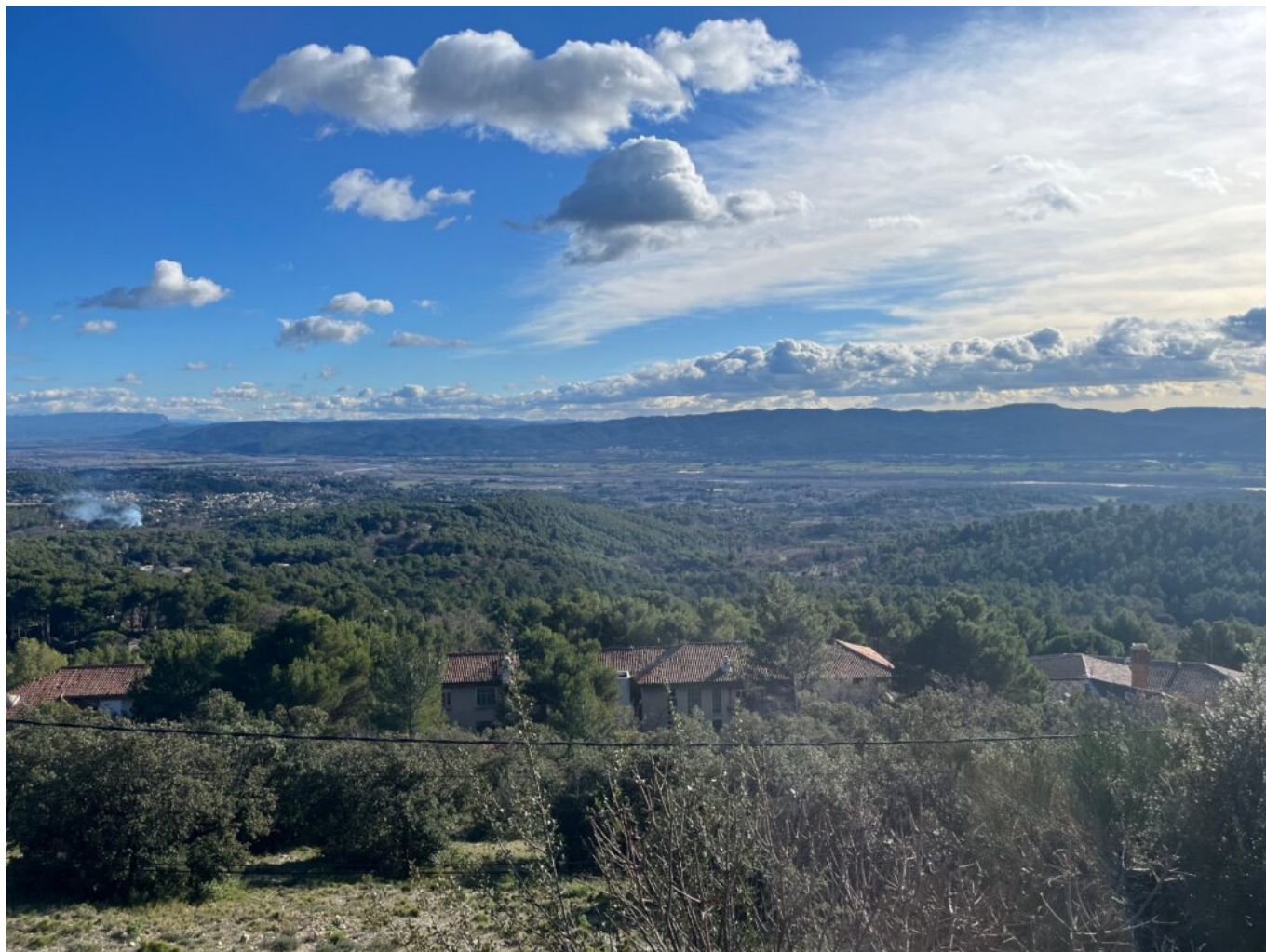
roquefranche vue du haut.

*chiffre communiqué par l'établissement au 11 décembre 2025