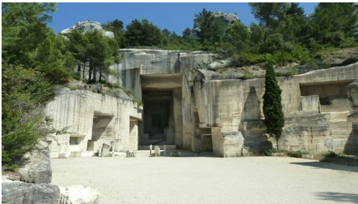
Entrée des Carrières de Lumières