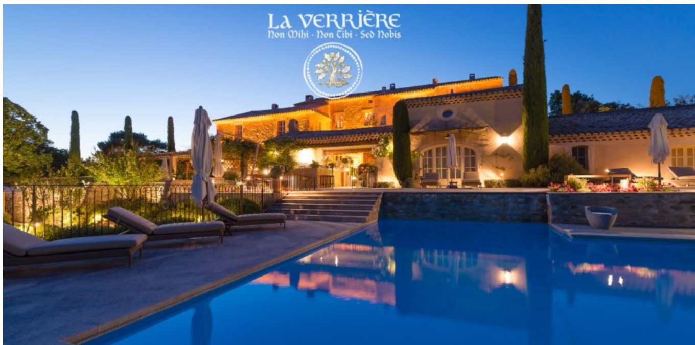
Le crépuscule des Dieux. @La Verrière

Sa posture de leader laisse une empreinte indélébile. Arrive la traditionnelle séance photo, il dirige, oriente la prise de vue. Mais il se résout très vite à adopter votre œil de photographe et vous laisse prendre la main. Ce qui vous marque ? Un verbe empreint de spiritualité et d'énergie positive. Le pont navigue entre les croyances ancrées du Moyen Âge, le taureau Vintur, Dieu du mal qui récolte les sacrifices humains (à l'origine du Mont Ventoux), la déesse Vaison et toute la symbolique de fertilité autour de la nature. Installé confortablement, son regard au loin se laisse transporter, animé d'une sagesse reconfortante. L'aura émanant de l'ancienne bastide du XVIII e est mystique.