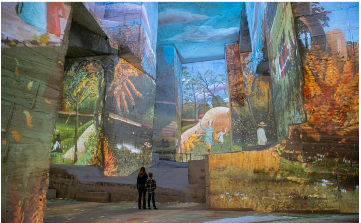
Œuvres du Douanier Rousseau

Plongez dans l'univers singulier d'Henri Rousseau, avec le programme court, aux Carrières des Lumières. À travers des œuvres vibrantes et oniriques, cette rétrospective nous invite à explorer l'univers de ce peintre autodidacte, dont l'imaginaire a su capturer les couleurs des paysages exotiques et la poésie d'un Paris industriel. Les jungles et les animaux sauvages prennent vie sous vos yeux, dans un hommage à l'audace créative de l'artiste surnommé le Douanier.