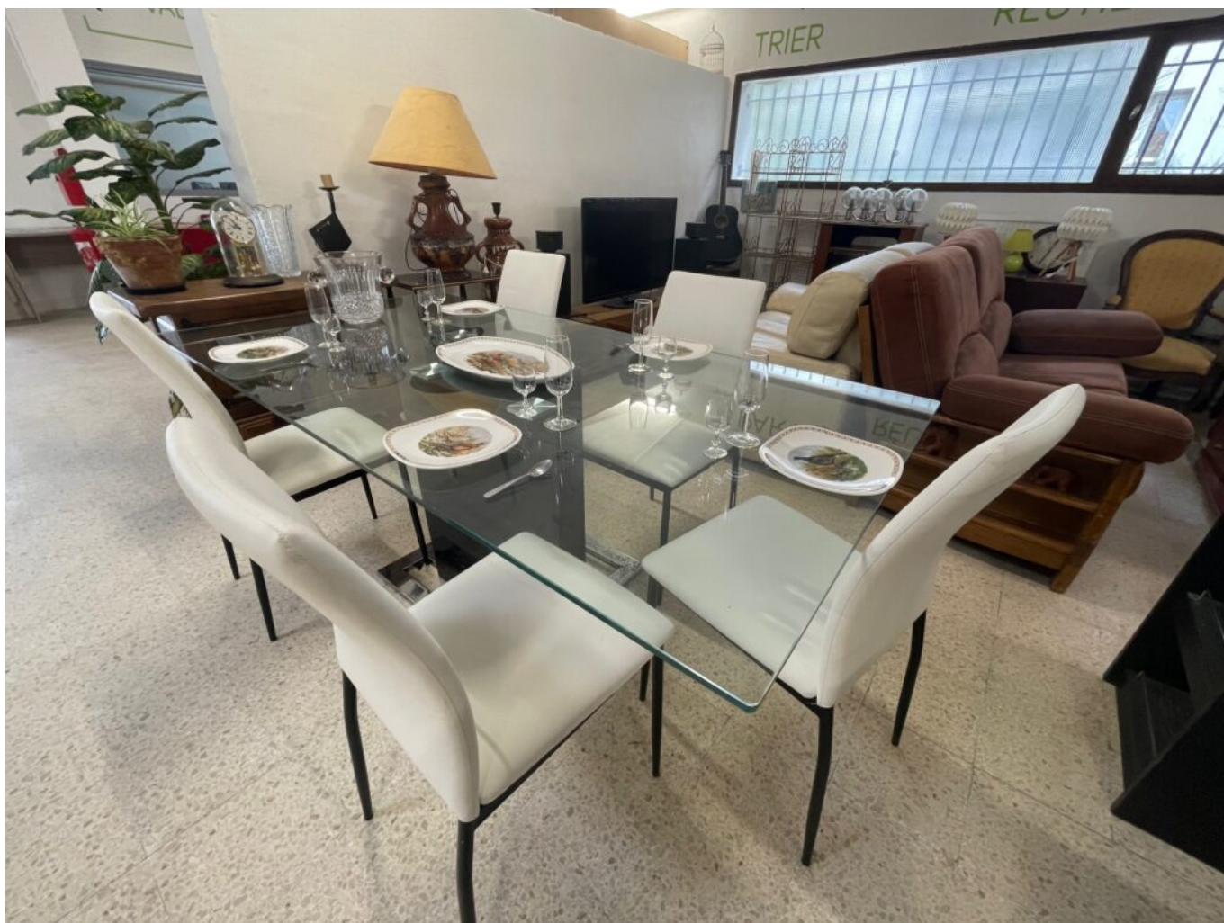
Un mobilier en parfait état