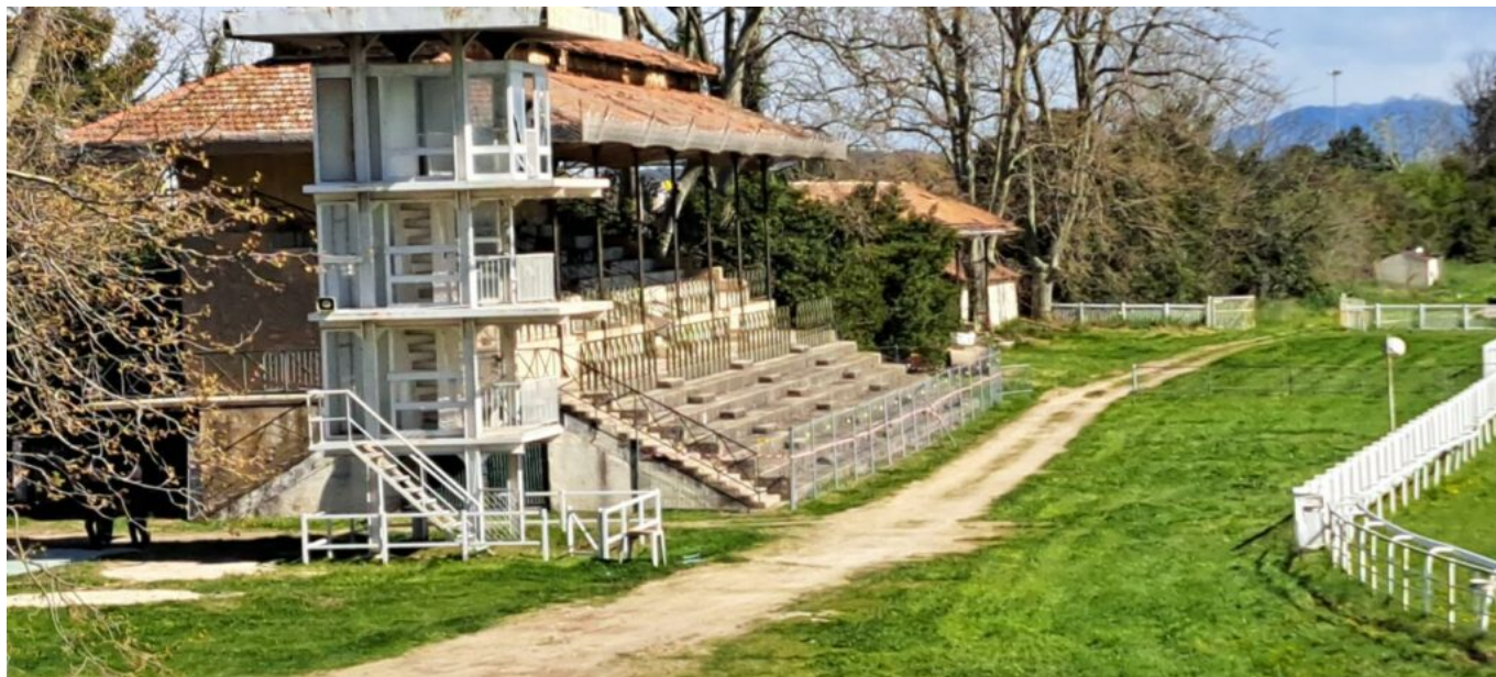
Les tribunes de l'hippodrome, classées au titre de Monument historique.