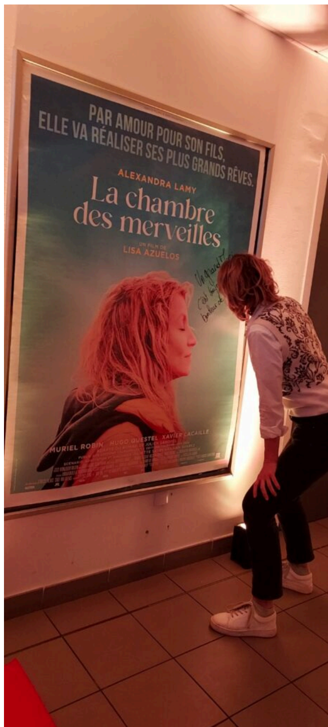
Alexandra Lamy dédicace l'affiche du film au Capitole.