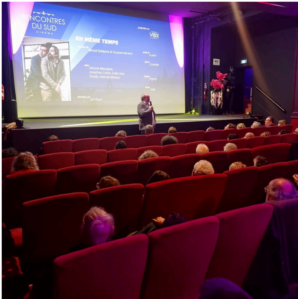
Les Rencontres du Sud en 2018.