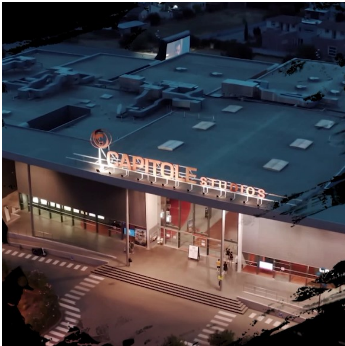
Le Capitole studios a vu le jour en 2009 au Pontet.