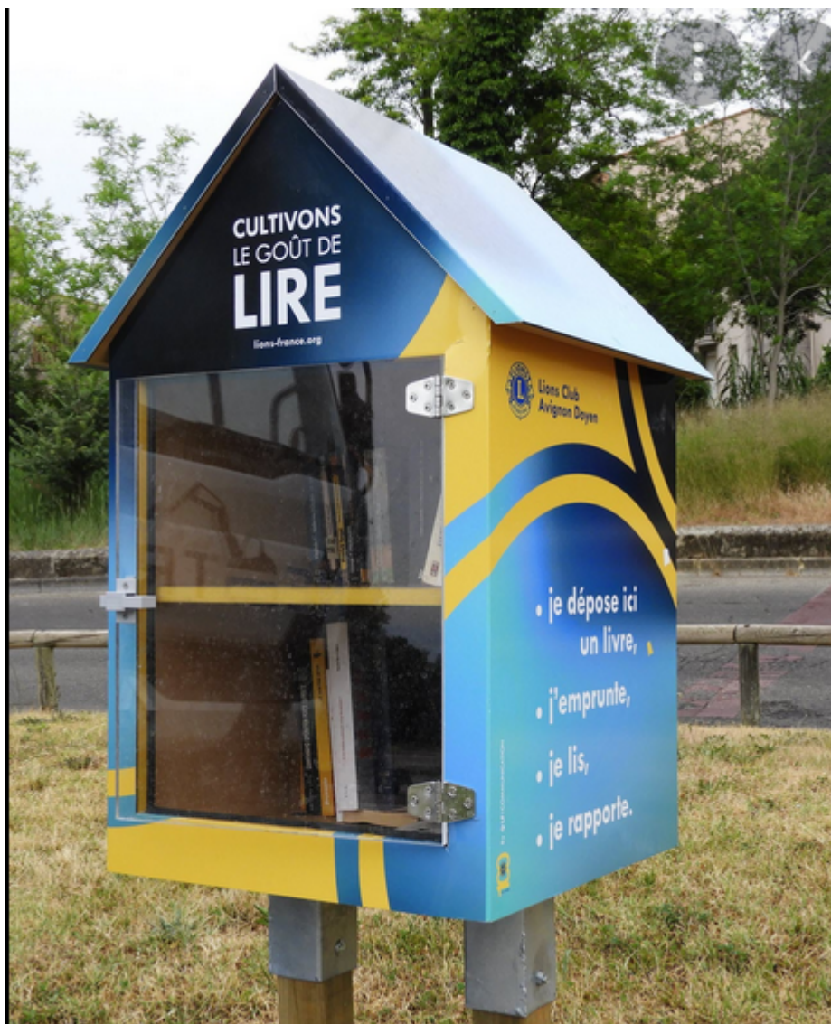
Les boîtes à lire