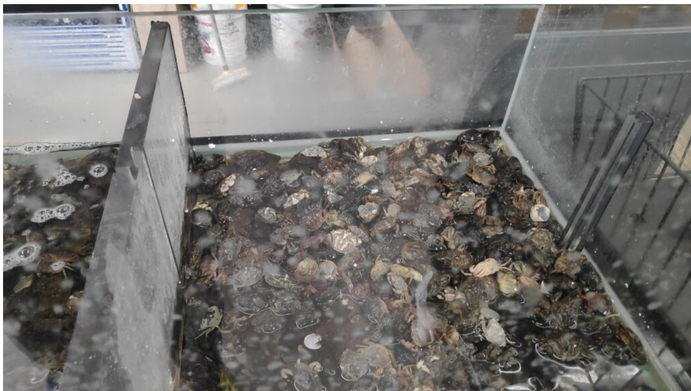
Vente de crabs pour la pêche en mer

«Bien sûr que cela nous révolte. mais nous ne travaillons pas du tout sur l'abattage des animaux -je suis moi même végétarienne-. Notre expertise reste la lutte en faveur des animaux exploités dans le loisir, le divertissement et la cohabitation pacifique avec les animaux liminaires. Cependant nous militons pour qu'il n'y ait pas de dérogations à la Loi. L'absence d'étourdissement pour des questions rituelles cascher ou halal est une exception à la Loi qui prévoit que lorsque l'on veut abattre un animal pour le manger, il doit être en théorie, inconscient. En effet, cette dérogation à la Loi est donc un scandale et il ne devrait pas y en avoir au regard de la protection animale.»