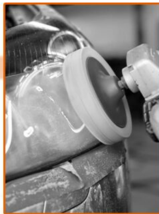
Rénovation optique de phares