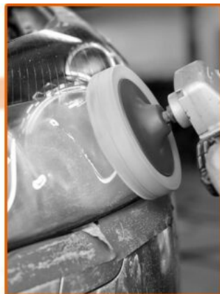
Rénovation optique de phares