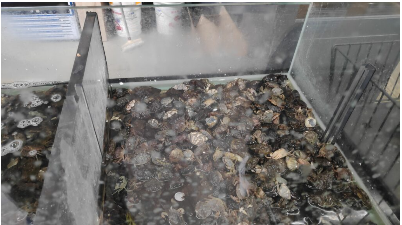
Vente de crabs pour la pêche en mer

«Bien sûr que cela nous révolte. mais nous ne travaillons pas du tout sur l'abattage des animaux -je suis moi même végétarienne-. Notre expertise reste la lutte en faveur des animaux exploités dans le loisir, le divertissement et la cohabitation pacifique avec les animaux liminaires. Cependant nous militons pour qu'il n'y ait pas de dérogations à la Loi. L'absence t'étourdissement pour des questions rituelles cascher ou halal est une exception à la Loi qui prévoit que lorsque l'on veut abattre un animal pour le manger, il doit être en théorie, inconscient. En effet, cette dérogation à la Loi est donc un scandale et il ne devrait pas y en avoir au regard de la protection animale.»