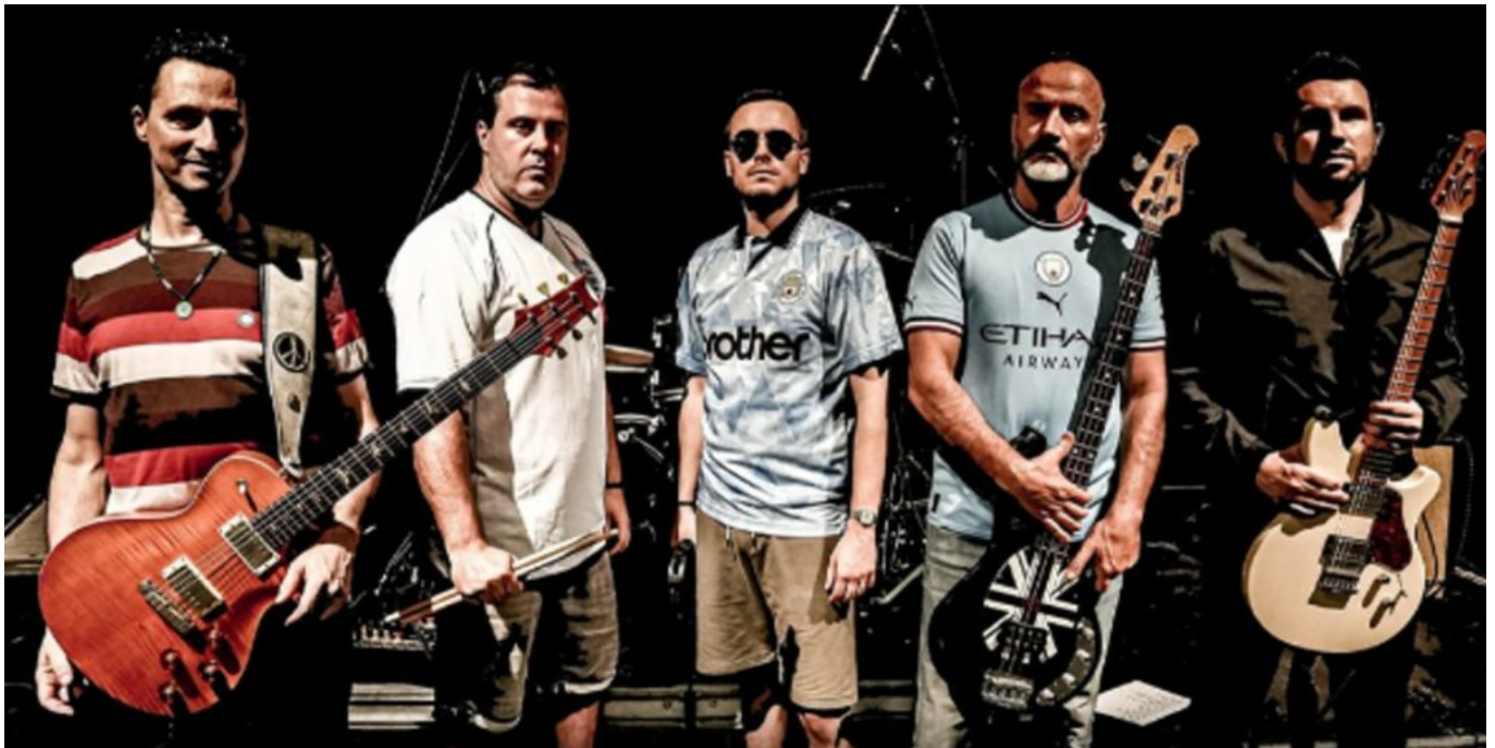
Le groupe Osiris.