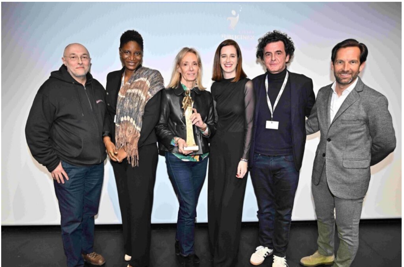
Le film Familiar touch, vainqueur du prix des « Montreurs d'Images. »