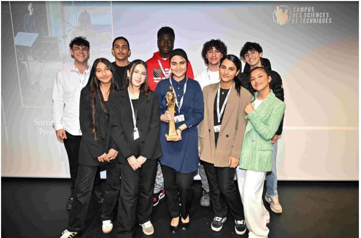
Le film Les Musiciens a remporté le prix des lycéens du Campus d'Avignon.