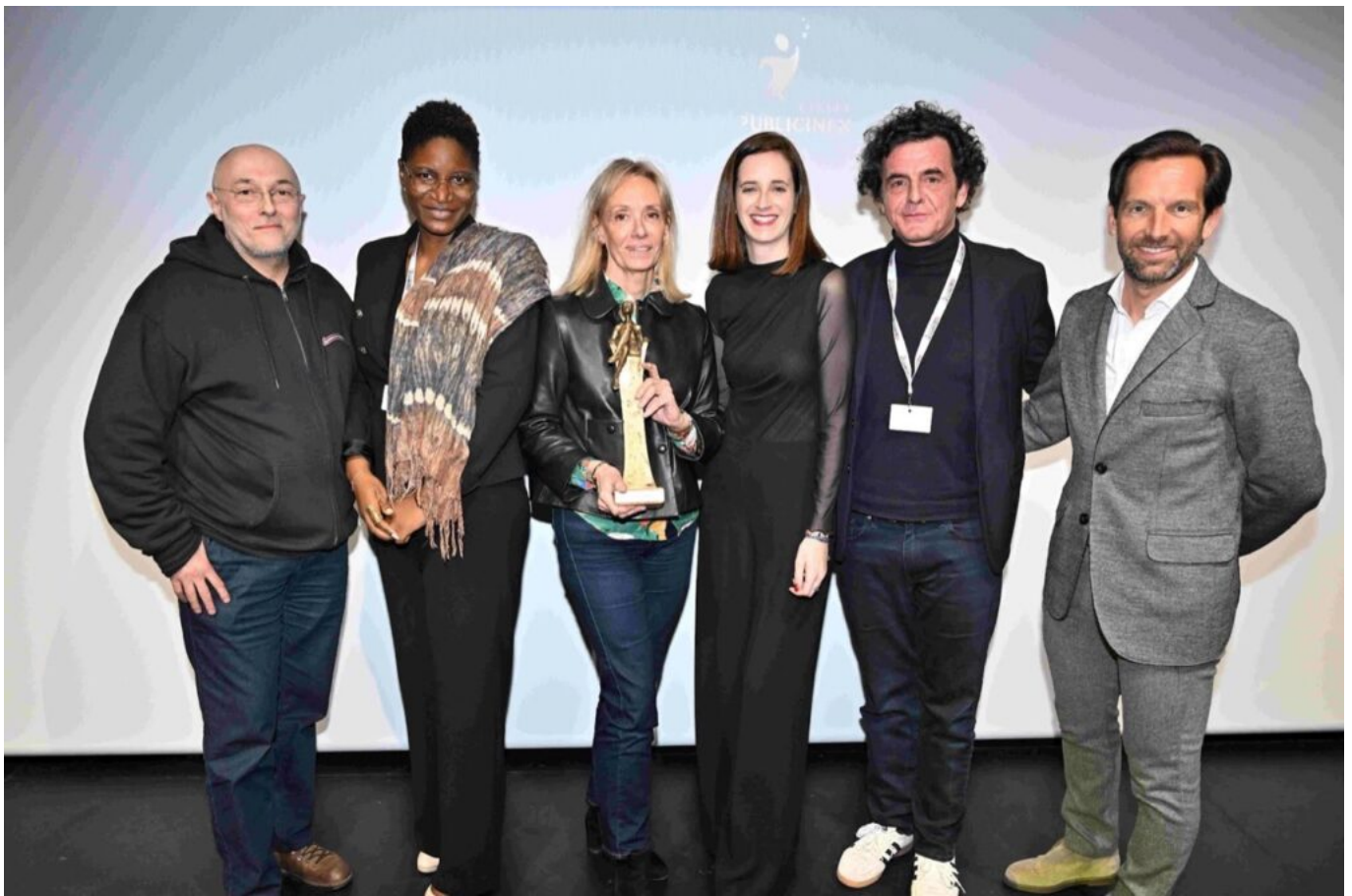
Le film Familiar touch, vainqueur du prix des « Montreurs d'Images. »