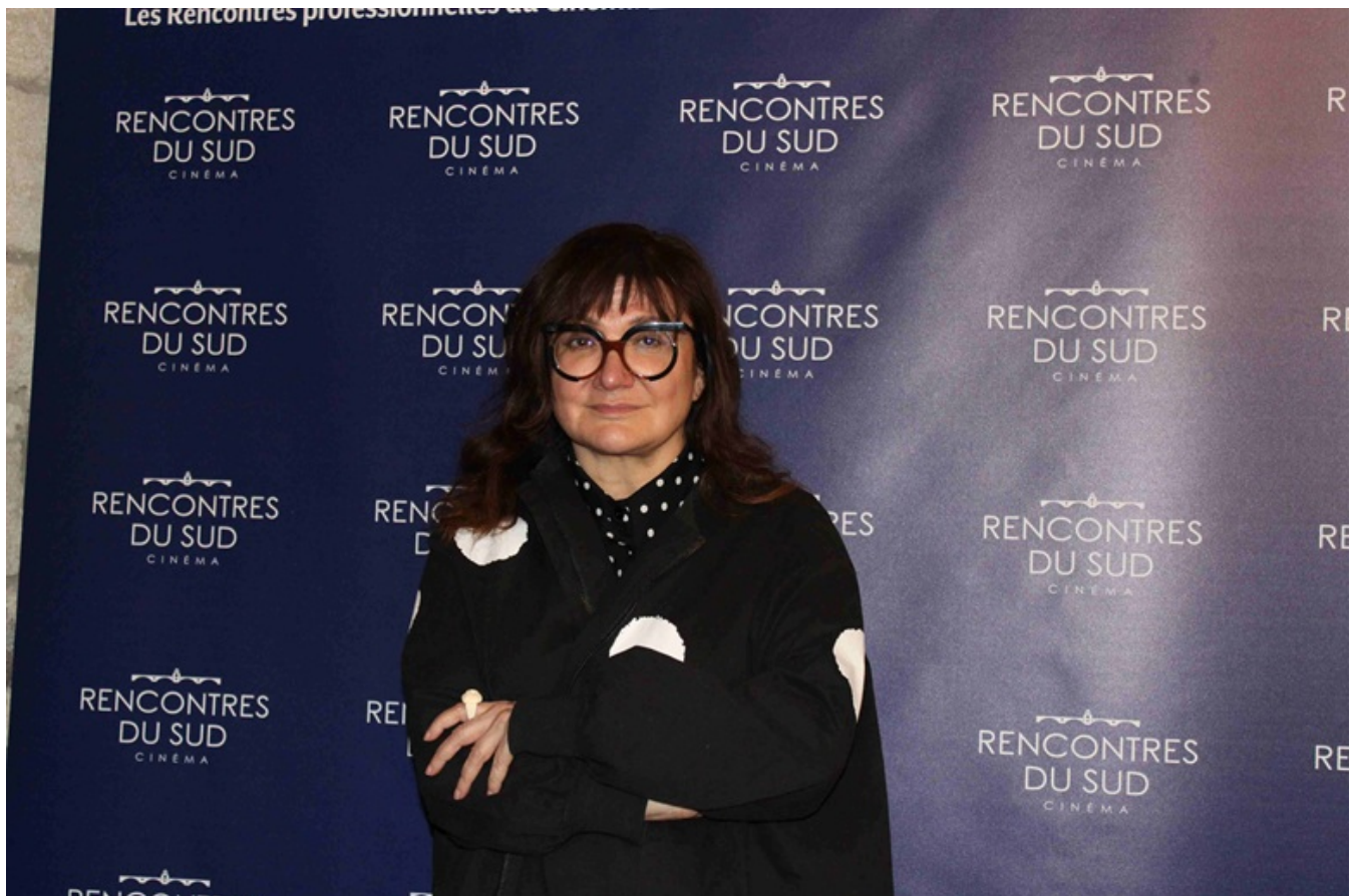
Isabel Coixet.