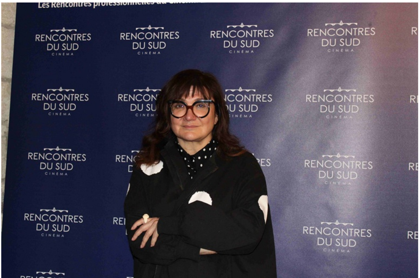
Isabel Coixet.

« J'avais fait Ma vie sans moi , adapté d'une nouvelle de Nancy Kincaid. Cette fois c'est l'histoire d'une femme seule, un peu asociale, renfermée sur elle-même. Après sa séparation avec un compagnon qui la laisse, puis la découverte de sa maladie, il y a un véritable changement en elle. Au début elle pense qu'elle va guérir mais après elle sait qu'elle n'y arrivera pas. La scène de l'enterrement du pigeon tué par des élèves, c'était l'occasion pour elle de dire ce qu'elle ne pourra pas dire à ses proches. La vie est faite d'adieux et là il y en a trois », explique Isabel Coixet qui a écrit le scénario en italien. Isabel alterne films et documentaires. « J'étais à Avignon il y a vingt-cinq ans avec Agnès Varda (qui est morte à 90 ans des suites d'un cancer). A Barcelone dans mon bureau j'ai un portrait d'Agnès et je parle beaucoup avec elle », conclut la réalisatrice dont le film Lovers avec Ben Kingsley et Pénélope Cruz a été produit à Hollywood, et le long-métrage Carte des sons de Tokyo a été sélectionné en compétition officielle en 2009 au festival de Cannes.