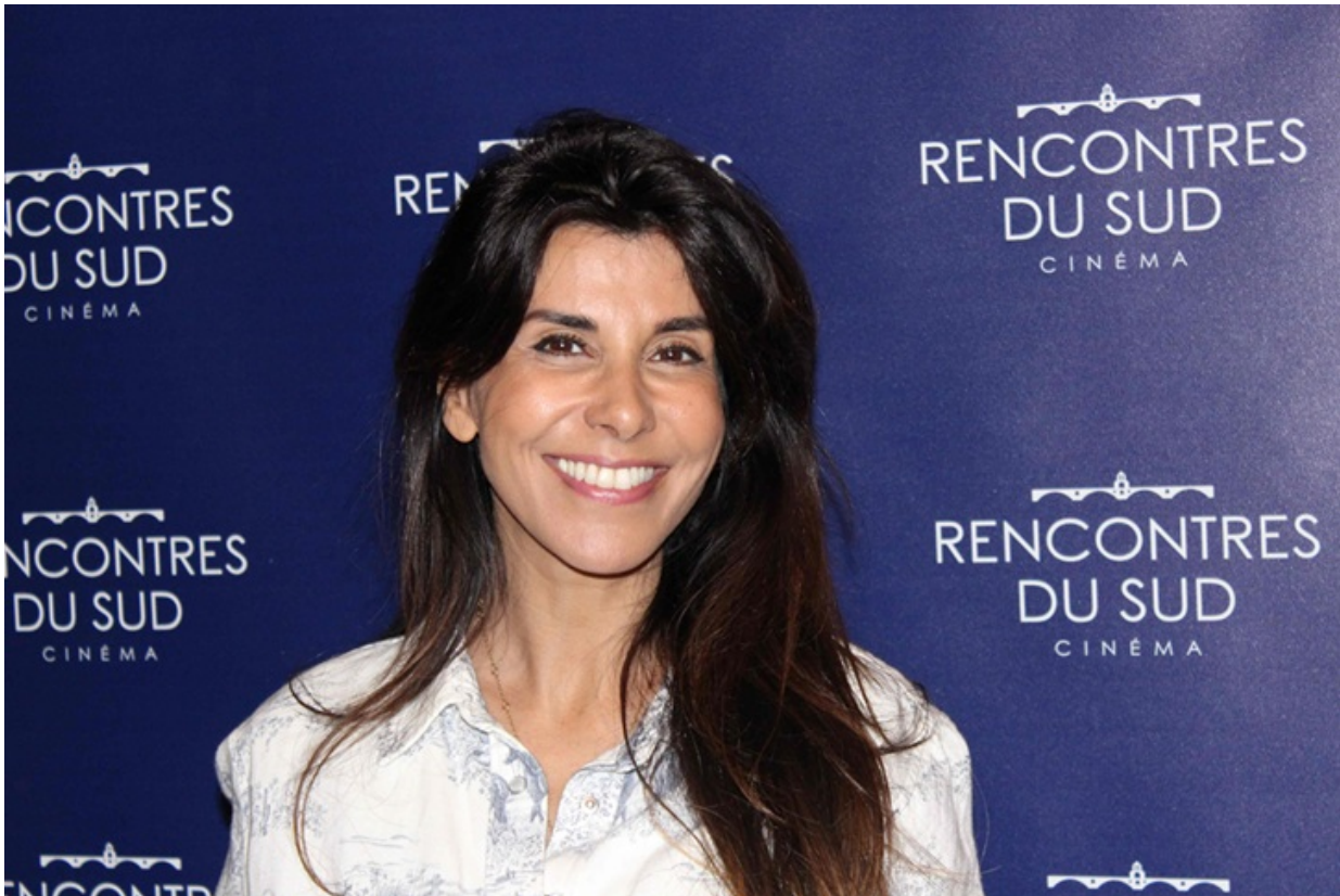
Reem Kherici.