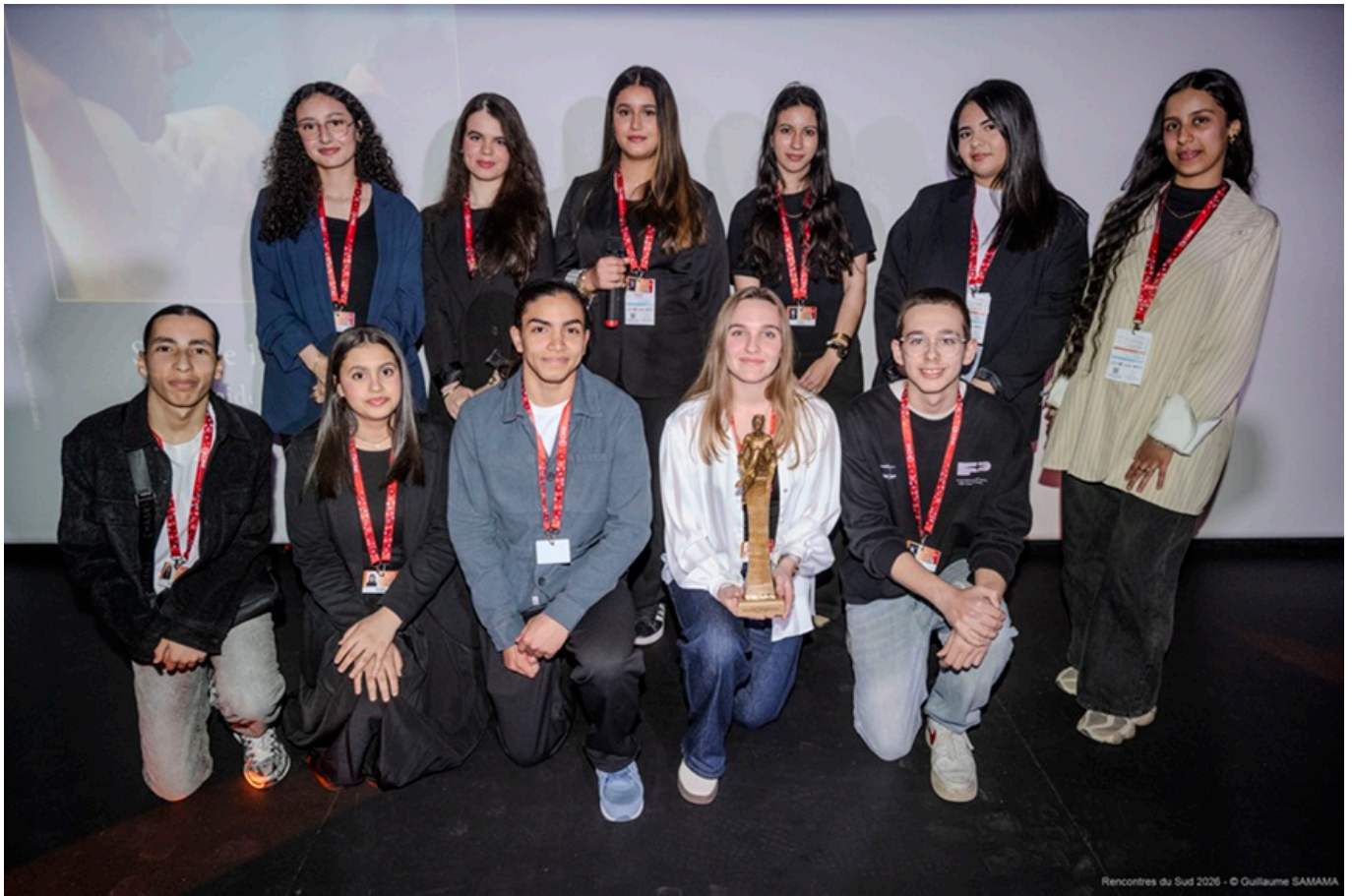
Prix des lycéens