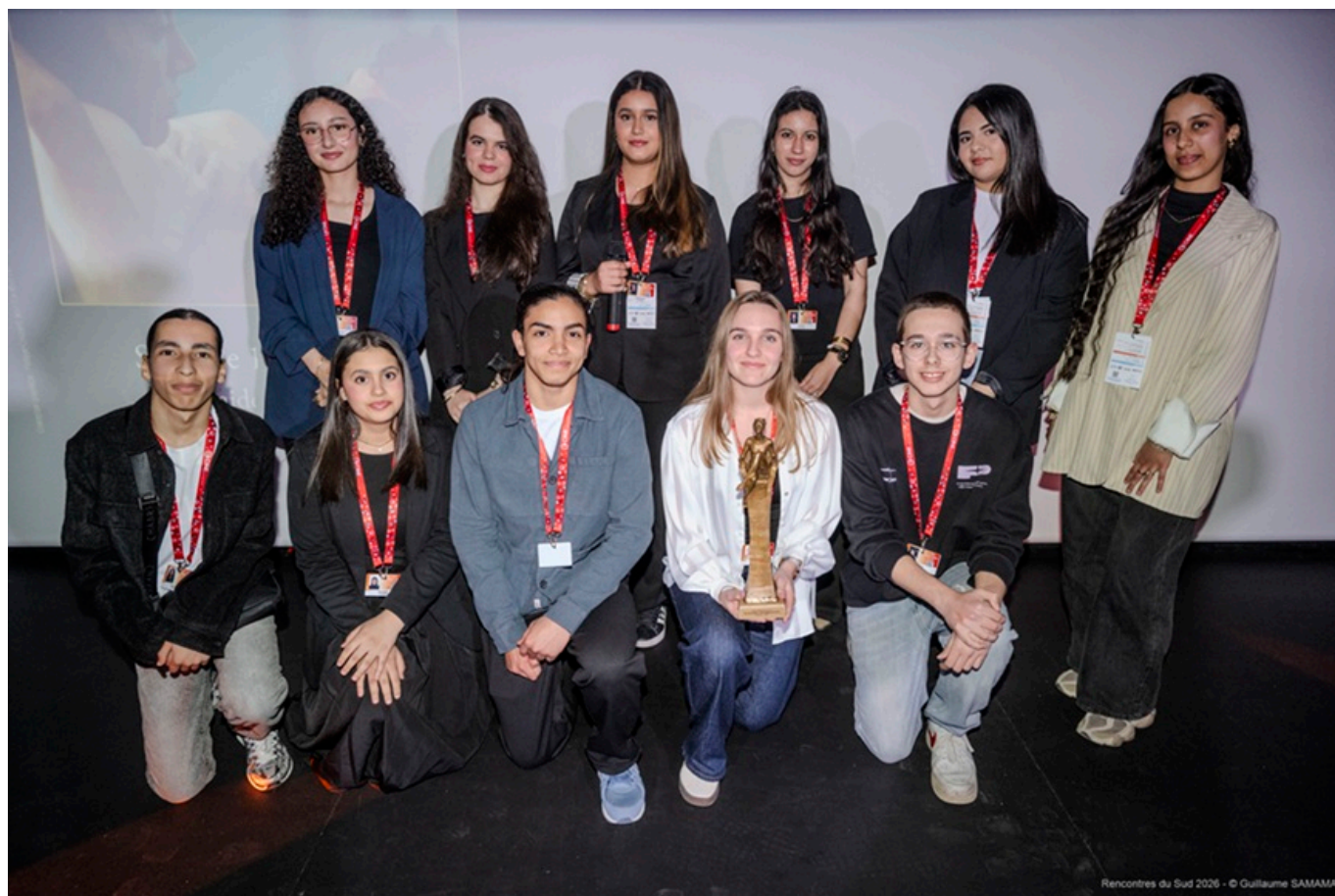
Prix des lycéens