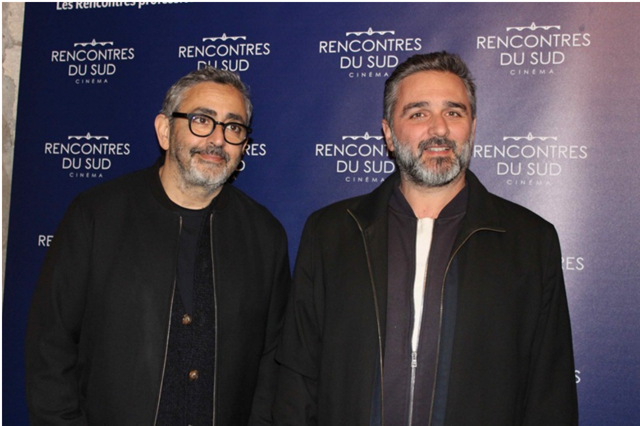
Eric Toledano et Olivier Nakache.