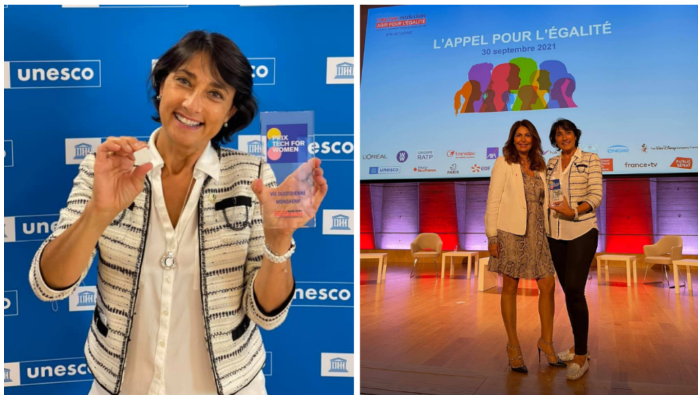
Le 30 septembre dernier Monsherif a été récompensé du prix 'Tech for women'.

Aujourd'hui, une quinzaine de personnes s'emploient à développer la solution dans l'hexagone. « Quand des personnes m'expliquent leur calvaire jusqu'au moment où elles ont ce bouton entre les mains, je me sens tellement petite, je visualise encore tout ce qu'il reste à accomplir. J'irai jusqu'au bout, pour toutes les personnes vulnérables qui ont besoin de ça », conclue-t-elle en brandissant la version 'Monsherif' en bijou scintillant connecté.