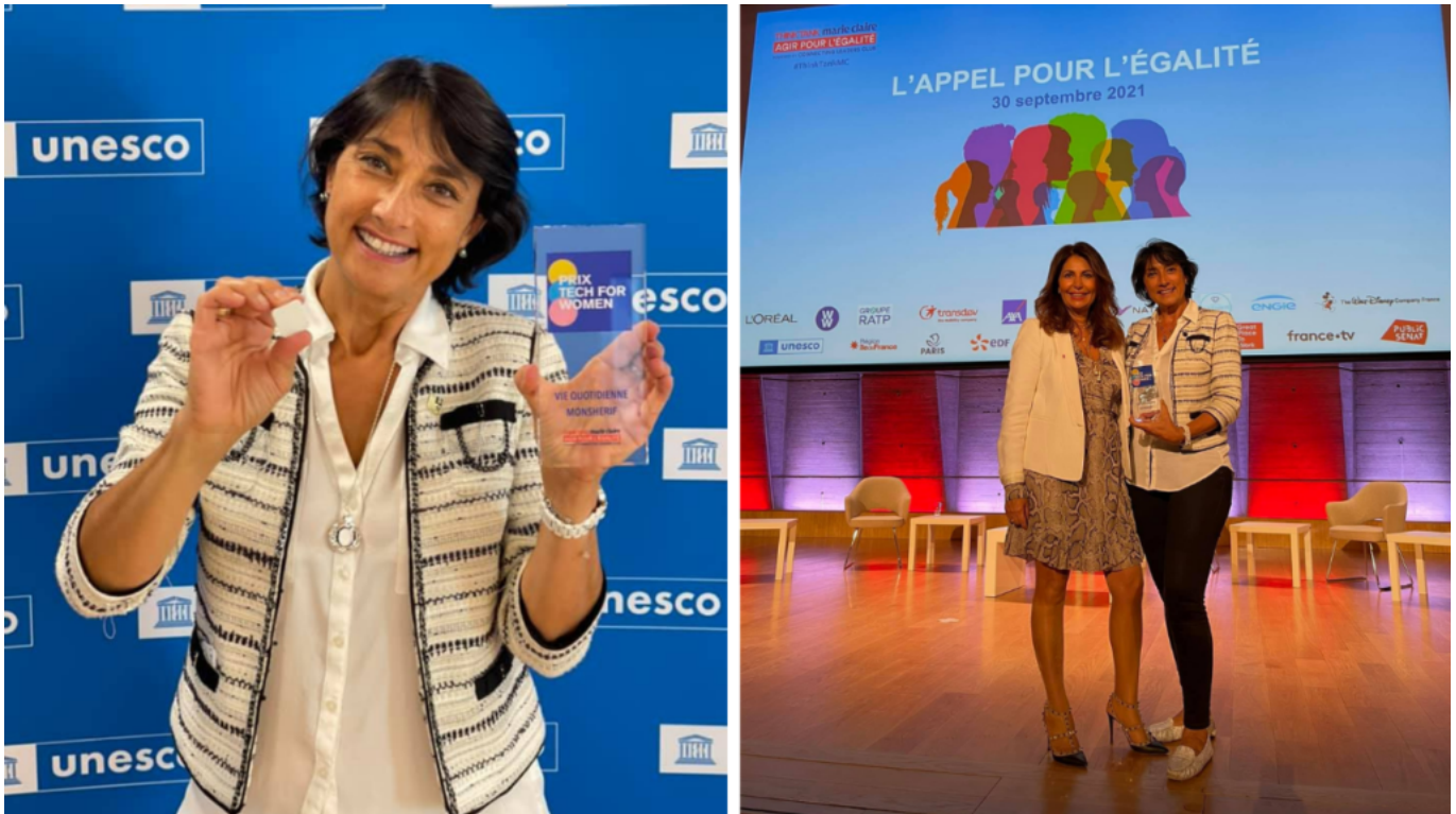
Le 30 septembre dernier Monsherif a été récompensé du prix 'Tech for women'.

Aujourd'hui, une quinzaine de personnes s'emploient à développer la solution dans l'hexagone. « Quand des personnes m'expliquent leur calvaire jusqu'au moment où elles ont ce bouton entre les mains, je me sens tellement petite, je visualise encore tout ce qu'il reste à accomplir. J'irai jusqu'au bout, pour toutes les personnes vulnérables qui ont besoin de ça », conclue-t-elle en brandissant la version 'Monsherif' en bijou scintillant connecté.