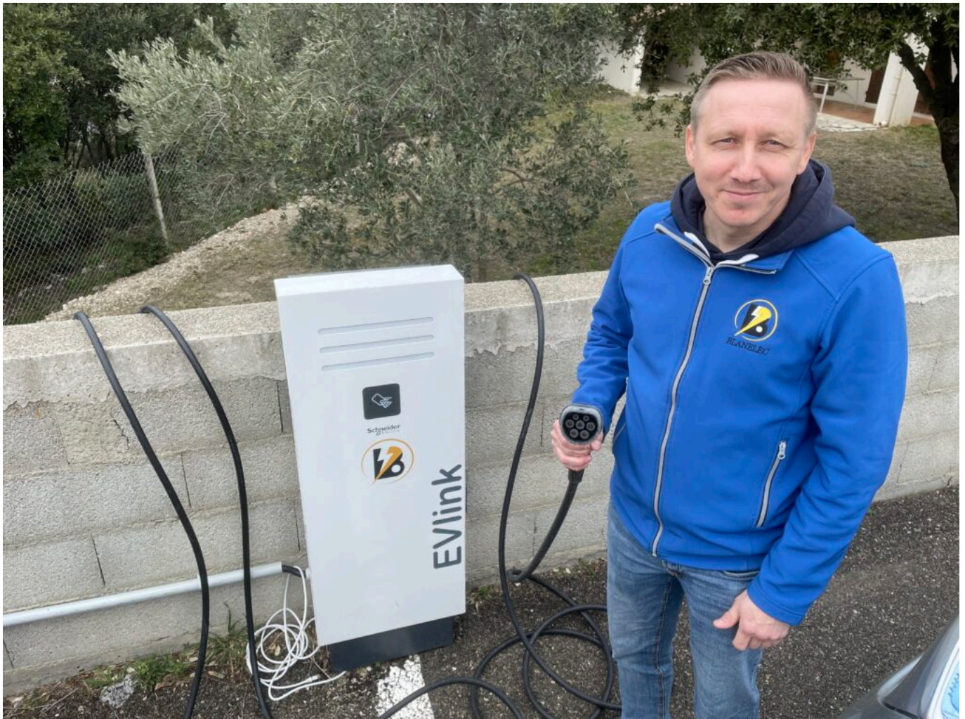
Autre système de borne de recharge