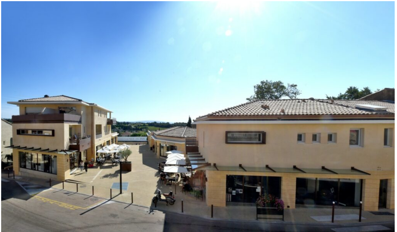
La place Jean-Moulin, nouveau lieu de vie du village.