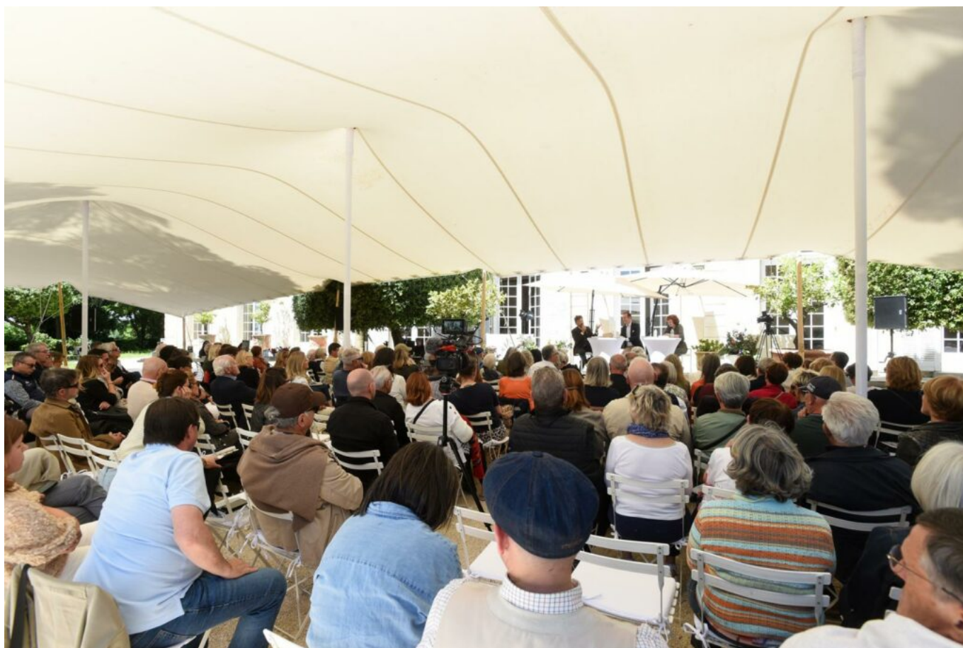
La 4eme édition des Causeries de Châteauneuf-du-Pape sur "La Beauté du Monde" au Château La Nerthe

Et l'écrivain nomade se rebelle avec véhémence contre « Le gouffre de la banalité. Cet appareillage technique récent qui prétend masquer notre perception du réel par un écran virtuel, une tablette, ces terminaisons bioniques, ce doigt d'honneur digital qui fait de nous des valets de la puce algorithmique. Stop aux grands manitous, les GAFAM (Google, Apple, Facebook devenu X , Amazon et Microsoft). Surout pas d'écran entre nous et le monde. » intime-t-il au public subjugué.