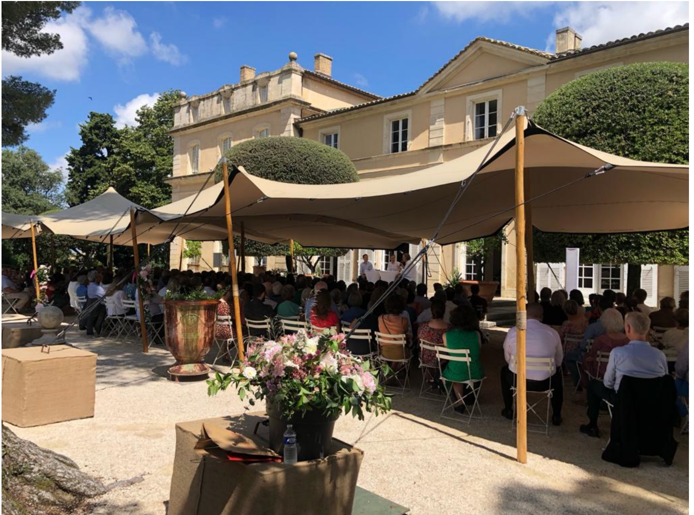
Le magnifique cadre du Château de la Nerthe