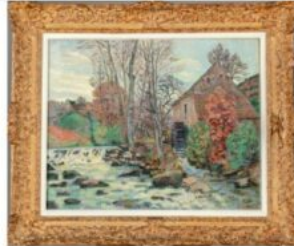
Armand GUILLAUMIN (1841-1927) : Moulin Charrault (dit Bouchardon). Huile sur toile signée en bas à droite, titrée sur le châssis et numérotée 21314. Dim. : 65,5x71 cm....