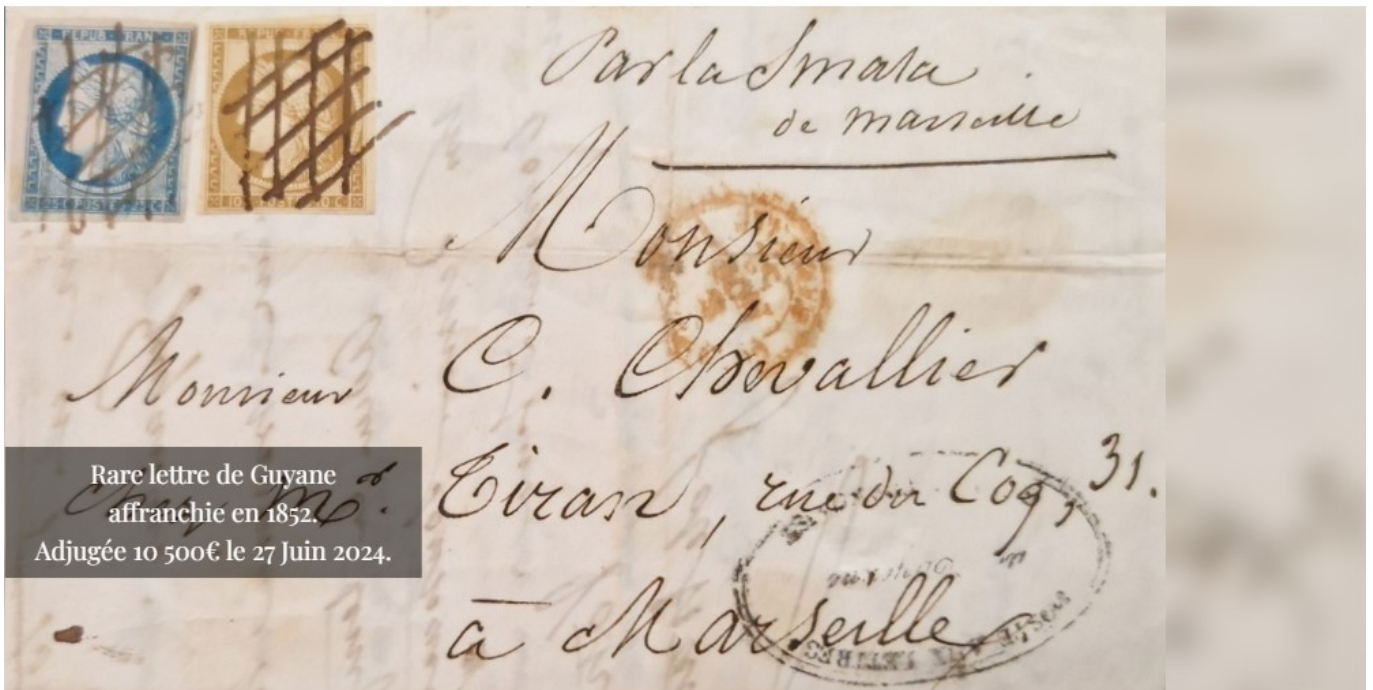
Rare lettre de Guyane affranchie en 1852. Adjudgée 10 500€ le 27 Juin 2024.