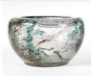
Emile GALLE (1846-1904) : * Les anisoptères * 1882. Rare et exceptionnelle coupe balustre évasée à large col annulaire rentrant. Epreuve en cristal soufflé au riche décor...