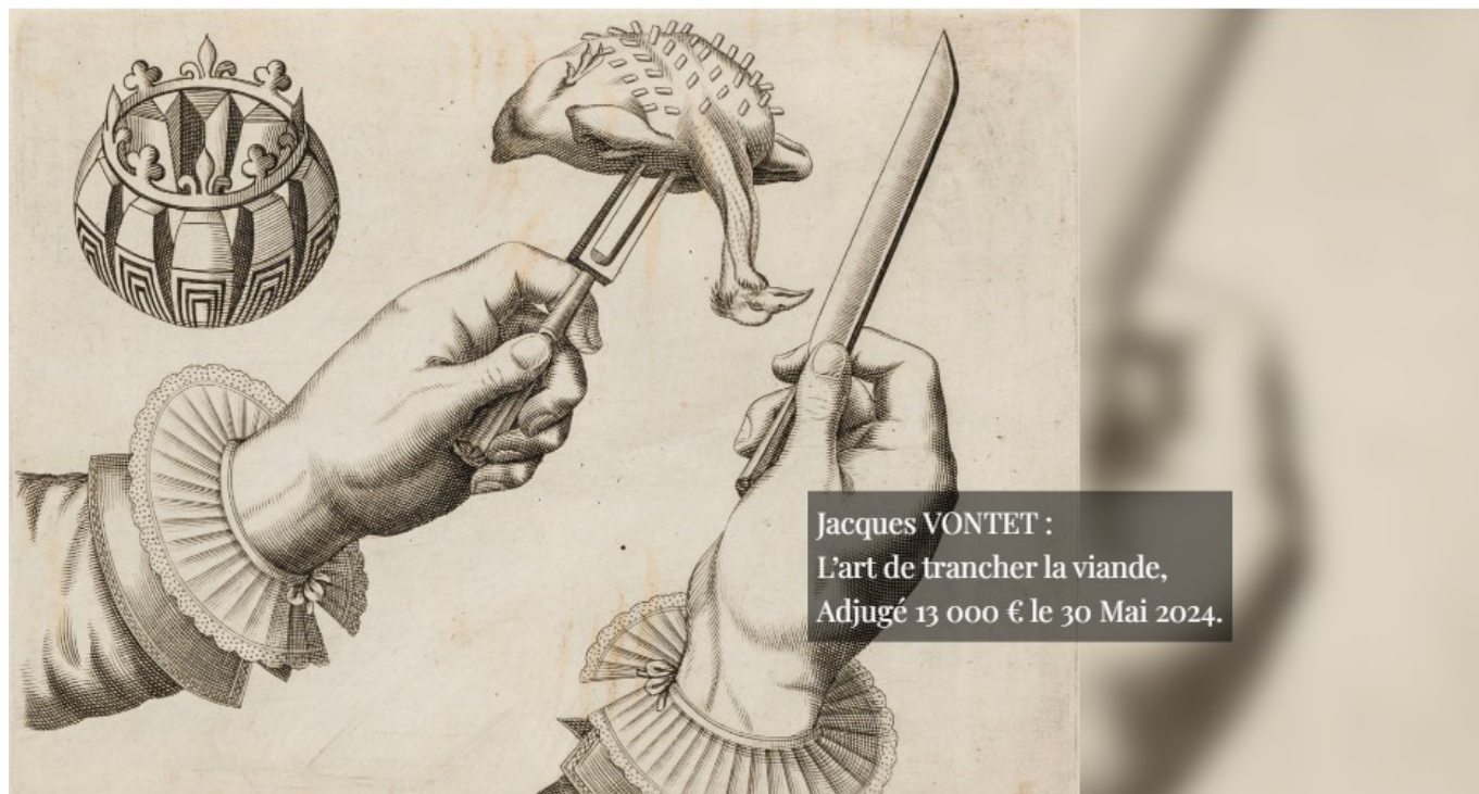
Jacques VONTET : L'art de trancher la viande, Adjugé 13 000 € le 30 Mai 2024.

Hôtel des ventes d'Avignon. 2, rue mère Teresa à Avignon. Fermé jusqu'à jeudi 29 août à 9h. Expertise sans rendez-vous tous les mardis de 9h à 12h et de 14h à 17h. Reprises aux horaires : du lundi au vendredi 10h-12h, 14h-17h. Mardi-jeudi : 9h-12h, 14h-18h. Mercredi 9h-12h. 04 90 86 35 35 contact@avignon-encheres.com