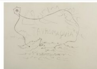
Pablo PICASSO (1881-1973): Jose DELGADO alias Pepe Illo - LA TAUROMAQUIA