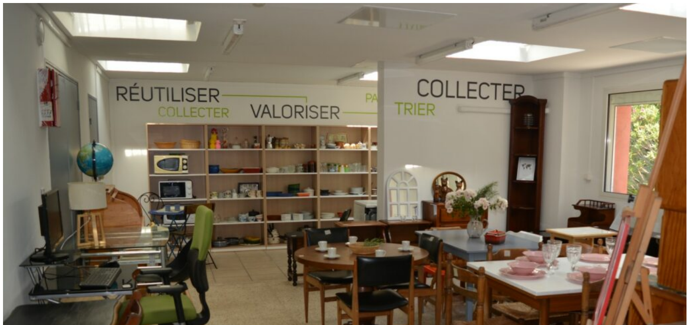
La recyclerie Delta Collect

Les mobiliers et objets d'électroménager seront collectés dans un périmètre de 30 minutes autour d'Avignon, sur des résidences ciblées par les agences, ou en apports volontaires directement au local de Delta Collect'. Les déménagements seront opérés pour les logements faisant l'objet de départ anormal ou lors de décès sans héritier connu. Les objets seront recensés et valorisés, notamment lorsqu'ils sont hors cadre -comme le textile et les vélos- via des partenaires comme D3E, puis distribués auprès de locataires identifiés par les travailleurs sociaux et chargés de clientèle. Également, la distribution se fait sur rendez-vous les mercredi après-midi et samedi matin dans les locaux de Delta Collect'. Outre l'aspect social et solidaire, de valorisation, de partage et de protection de l'environnement, ce nouveau service s'inscrit dans la labellisation qualicoop (visibilité et diversité des pratiques coopératives) initiée par les Coop'Hlm.