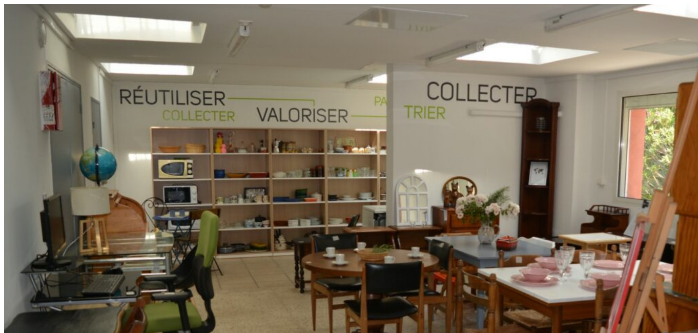
La recyclerie Delta Collect

Les mobiliers et objets d'électroménager seront collectés dans un périmètre de 30 minutes autour d'Avignon, sur des résidences ciblées par les agences, ou en apports volontaires directement au local de Delta Collect'. Les déménagements seront opérés pour les logements faisant l'objet de départ anormal ou lors de décès sans héritier connu. Les objets seront recensés et valorisés, notamment lorsqu'ils sont hors cadre -comme le textile et les vélos- via des partenaires comme D3E, puis distribués auprès de locataires identifiés par les travailleurs sociaux et chargés de clientèle. Également, la distribution se fait sur rendez-vous les mercredi après-midi et samedi matin dans les locaux de Delta Collect'. Outre l'aspect social et solidaire, de valorisation, de partage et de protection de l'environnement, ce nouveau service s'inscrit dans la labellisation qualicoop (visibilité et diversité des pratiques coopératives) initiée par les Coop'Hlm.