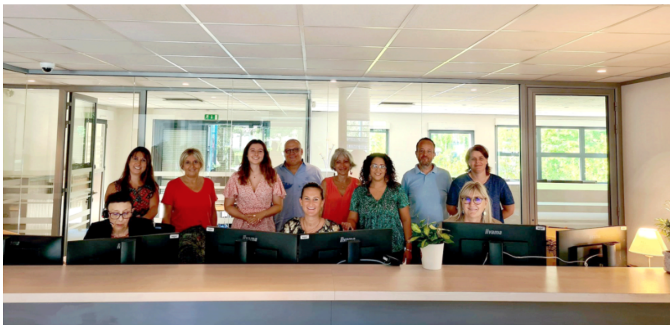
L'équipe GDH de la nouvelle agence des sources

L'agence, résolument high tech avec son grand écran installé dans la salle d'attente et une borne interactive, fait la part belle à des espaces de travail ouverts disposant de la lumière naturelle, d'une salle de formation, de deux salles de réunion, de bureaux dont l'un est nomade, d'un espace détente, d'une réception du public dotée de box séparés pour favoriser la confidentialité.