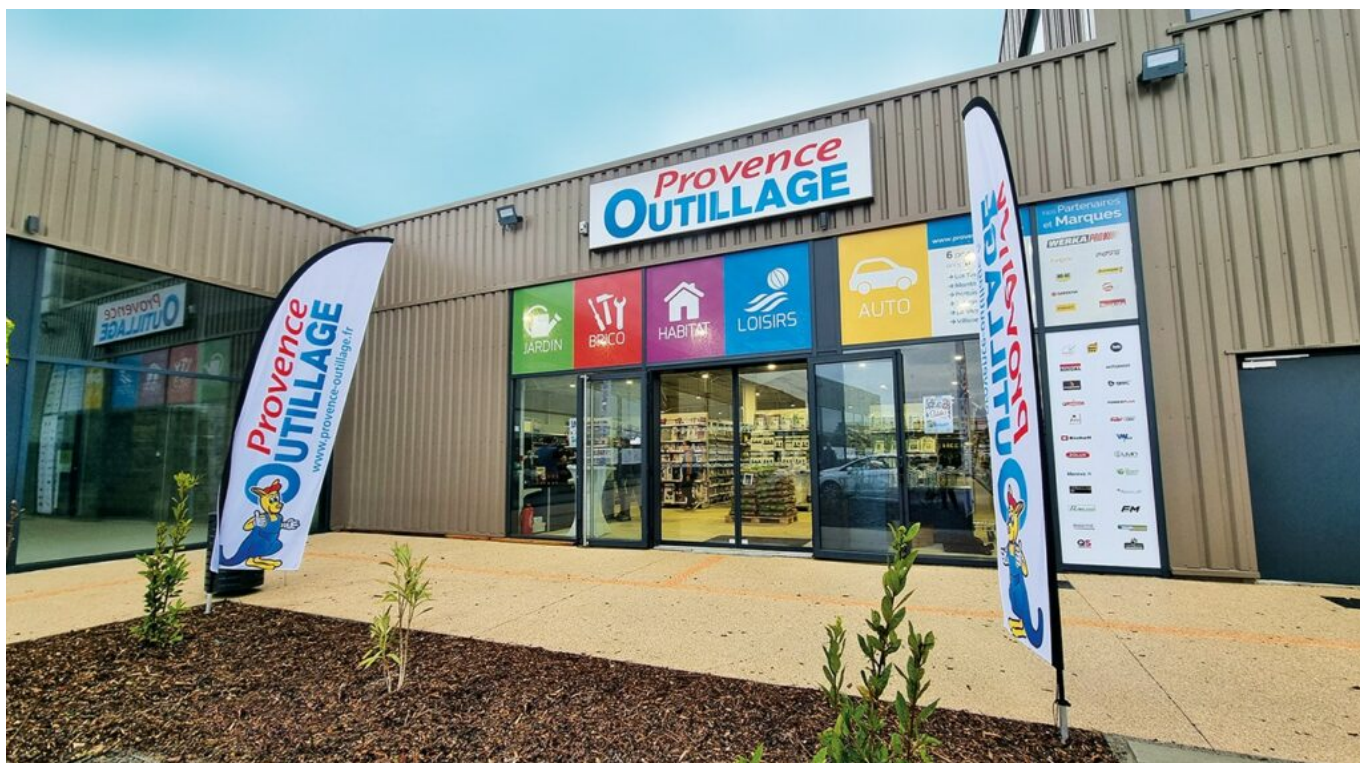
Le magasin de Montoux.

« Il y a aussi des temps forts pour nos ventes, comme la fête des pères et les soldes. 50% de notre chiffre d'affaires proviennent du site en ligne, 25 à 28% des magasins et le reste de notre propre marque fournie à d'autres. » Le chiffre d'affaires tourne autour de 16M€.