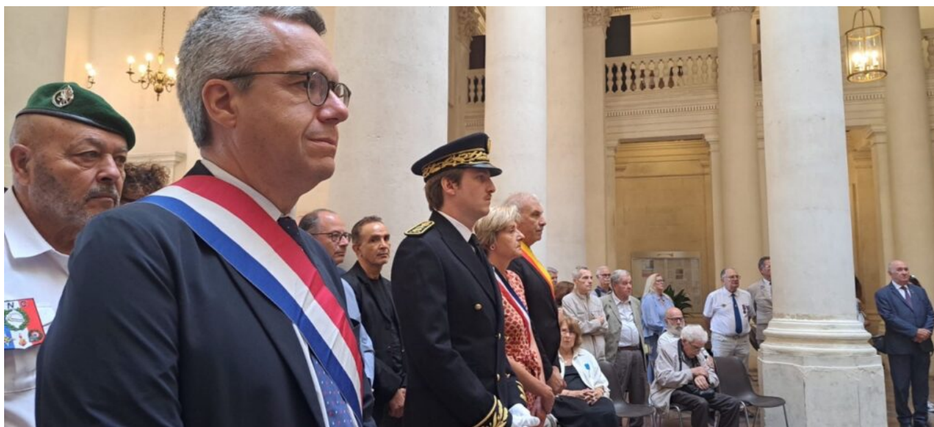
Le sénateur Jean-Baptiste Blanc et le sous-préfet Thibault de Cacqueray